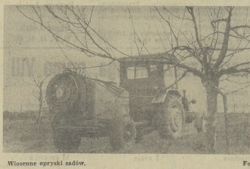
Wiosenne opryski sadów.