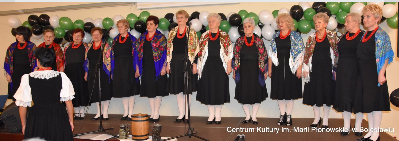
Centrum Kultury im. Marii Płonowskiej w Bolesławiu