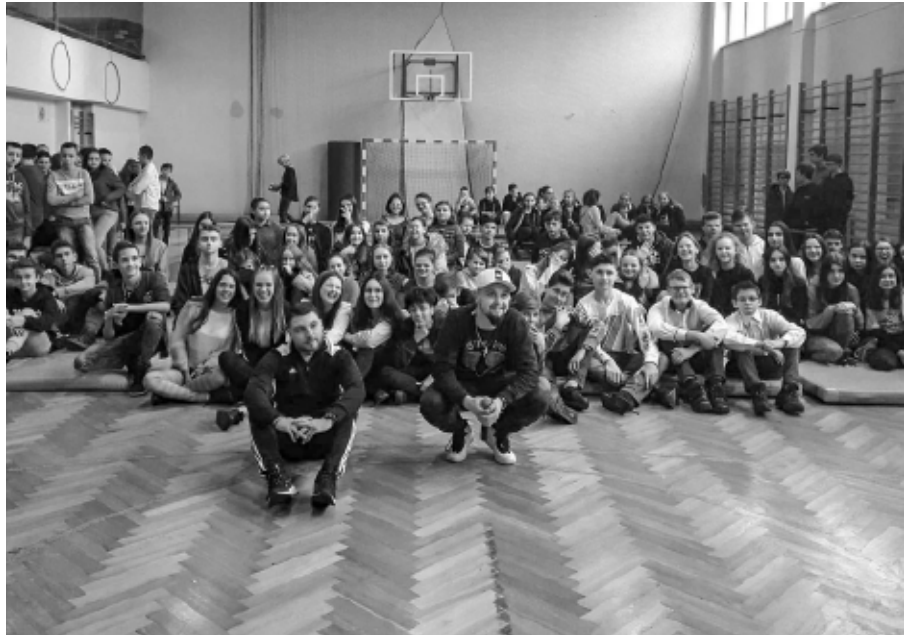
Wspólne zdjęcie rapera z uczniami.