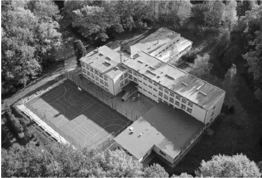
Budynek szkoły z nowoczesnymi pracowniami tematycznymi

„Rocznice są wzniesieniami w krajobrazie naszego życia. Kierując one nasz wzrok w stronę przebytej drogi...”