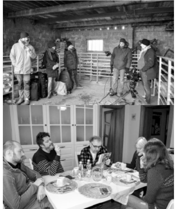
Zdjęcia z planu filmowego