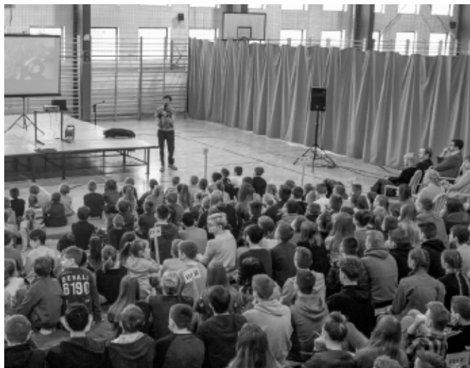
Uczniowie SP 2 podczas spotkania z Jaśkiem Melą

Podczas spotkania podróżnik pokazywał zdjęcia z wypraw, opowiadał o relacjach w swojej rodzinie, o fundacji, która pomaga osobom po amputacji na nowo rozpocząć życie („Zaakceptowanie siebie po wypadku było najtrudniejsze. Zajęło mi to jakieś dziesięć lat”).