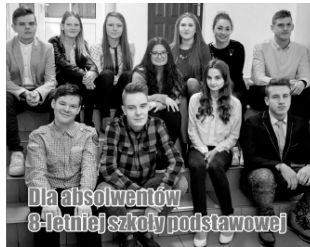
Technik żywienia i usług gastronomicznych