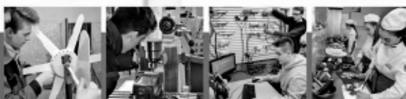
Technik urządzeń i systemów energetyki odnawialnej

mechanik pojazdów samochodowych, operator obrabiarek skrawających, ślusarz, mechatronik, kowal, kucharz, piekarz, cukiernik, sprzedawca, fryzjer, murarz-tylnikarz