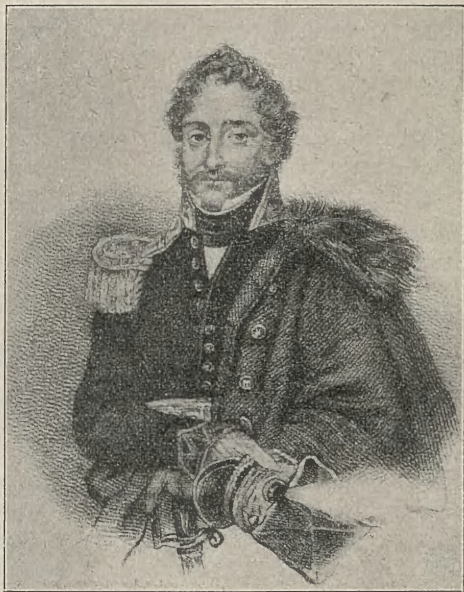
GENERAL ANTONI OSTROWSKI.

I z duszy narodu jakże odruchowo i samorzutnie wydziera się dzisiaj westchnienie: Gdybyż tego ducha posiadało pokolenie 31-go roku, mające w rękę oręż? Gdybyż powstanie styczniowe miało broń i żołnierza z tamtej wojny!