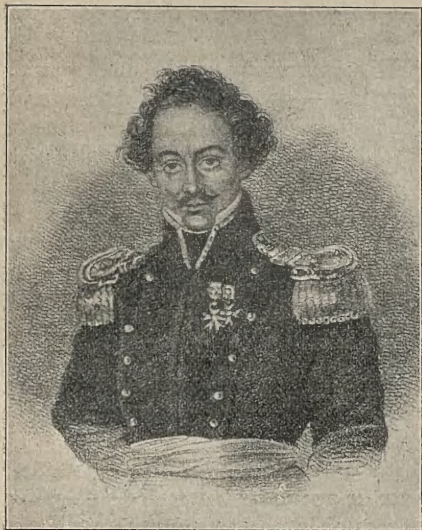
GENERAL R. SOLTYK.