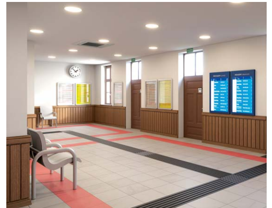
Kraków Swoszowice – wnętrze budynku. Wizualizacja PKP SA

W bezpośrednim otoczeniu budynku znajdują się ławki, kosze na śmieci, stojaki rowerowe oraz 15 miejsc postojowych (w tym 2 dla niepełnosprawnych). Projekt modernizacji obejmuje także uporządkowanie zieleni oraz montaż schodów i pochylni prowadzących na ul. Hubalczyków.