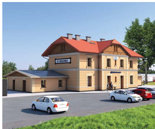
Kraków Swoszowice – otoczenie. Wizualizacja PKP SA

Na wspomnianej trasie znajduje się też przystanek Kraków Swoszowice, który ma być w przyszłości węzłem przesiadkowym. Aby tak się stało, konieczne jest współdziałanie aż 3 podmiotów – PKP PLK prowadzi prace