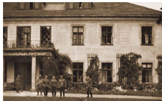
3.09.1939 roku – żołnierze niemieccy przed pałacem w Kozach