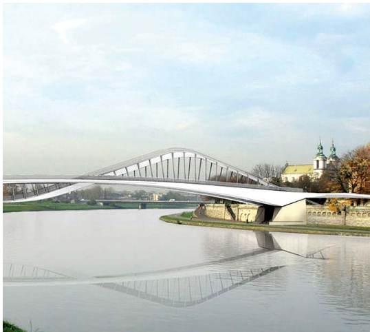
Wizualizacja Biuro Projektów Lewicki Łatak Sp. z o.o. Sp.K.

Koncepcja kładki między Ludwinowem (między ulicami Wilgi a hotelem Forum) a Kazimierzem (okolicie ulic Wietora i Skawińskiej) powstała już w 2006 r. Do dziś nie została zrealizowana z różnych powodów. Najpierw był kryzys gospodarczy z lat 2008-2009, który dotknął też finanse Krakowa, potem były kłopoty z uzyskaniem wszelkich niezbędnych pozwoleń. Futurystyczny projekt w kształcie sinusoidy (150 m długości i 15 m wysokości) nie zyskał akceptacji Narodowego Instytutu Dziedzictwa i w konsekwencji Małopolski Wojewódzki Konserwator Zabytków uchylił swoją wcześniejszą po-