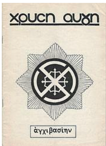
Fot. 1. Okładka pierwszego numeru magazynu „Xrysi Avgi”.