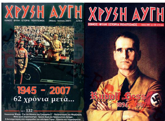
Fot 2. Wybrane okładki numerów magazynu „Xrysi Avgi” z lat 2006–2007.