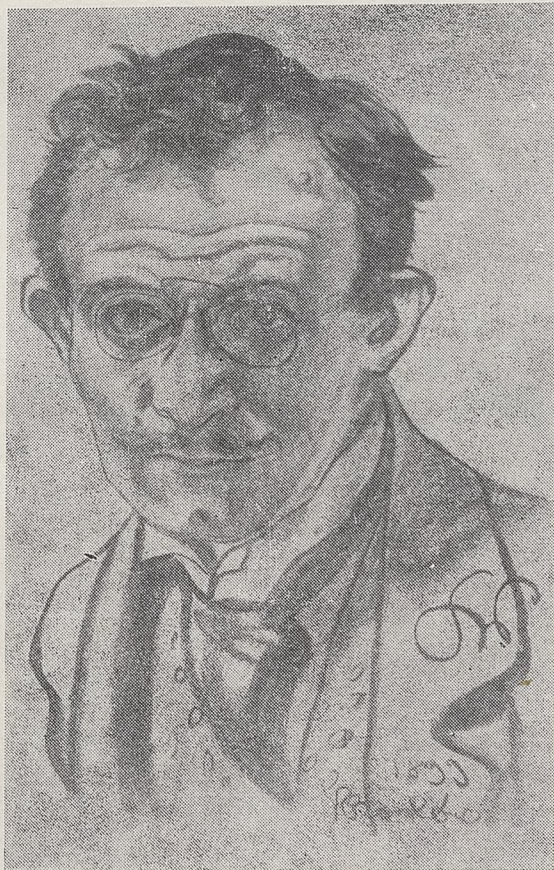
LUCJAN RYDEL (pastela St. Wyspiańskiego)