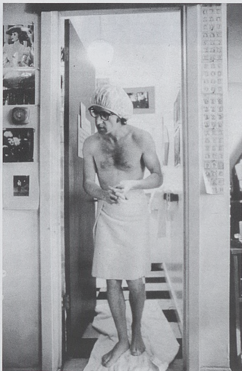
„Zagraj to jeszcze raz, Sam”, reż. Woody Allen

Nie sądziłeś, że takie sytuacje są możliwe tylko w filmie. Myślałeś sobie: „Cóż, to nie jest moje życie. Mieszkam przecież w ubogim miejscu na Brooklynie. Ale jest na pewno wielu ludzi na świecie, którzy mają takie domy, biorą udział w wyścigach konnych, spotykają piękne kobiety, a wieczorami chodzą na koktajle.” To był całkowicie inny świat. Potwierdzały ten obraz kolorowe magazyny, w których mogłeś przeczytać o ludziach żyjących zupełnie inaczej i szczęśliwych jak bohaterowie filmów. Było to druzgocące wrażenie i nigdy nie udało mi się tego do końca przezwyciężyć. I znam wielu ludzi, którym również się nie