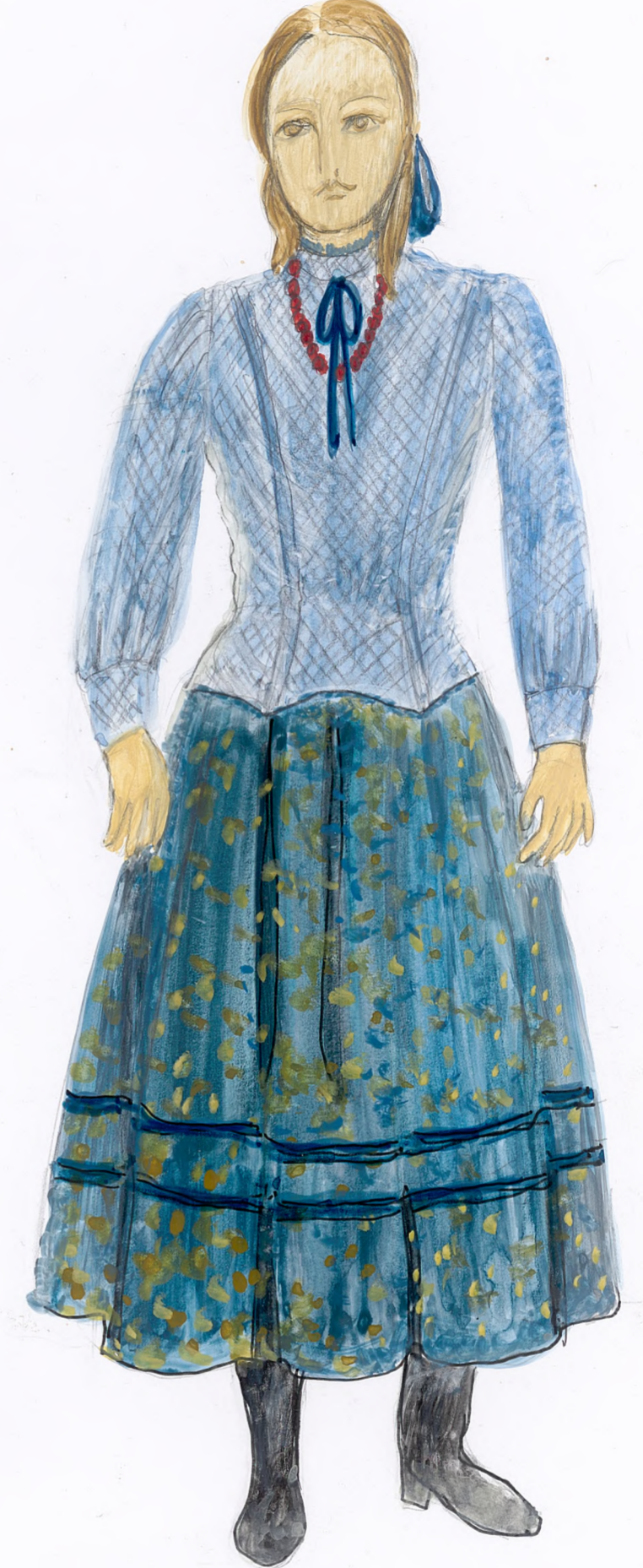
SZAKAPAK . JAKUBIK