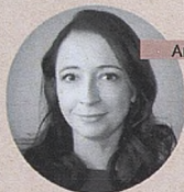
Andromacha Żona Hektora.

Na polecenie Zeusa, rozstrzygnął spór między Herą, Ateną i Afrodytą, uznając tą ostatnią za najpiękniejszą z bogiń. W zamian za to, ona pomogła mu uprowadzić Helenę. Oskarżany przez Trojan o wywołanie wojny, tchórzostwo i brak męstwa. Ale to właśnie on, z pomocą Apollina, zglądził Achillesa, godząc go w jego śmiertelną piętę zatrutą strzałą