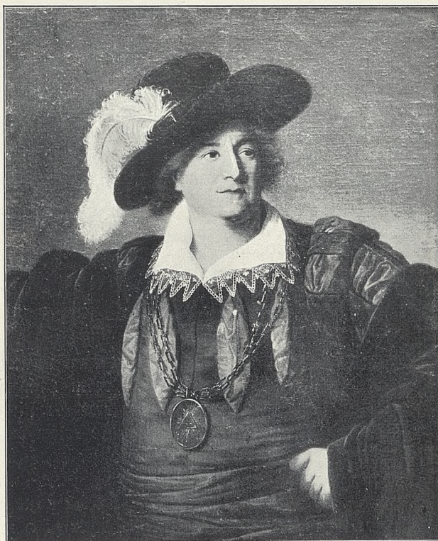
Fig. 1. Bacciarelli (?). Portret Stanisława Augusta.

Prócz tych dwóch większych kolekcji uzyskało Muzeum tą samą drogą szereg monet i medali polskich, z których niektóre są prawdziwą ozdobą gabinetu numizmatycznego. Są to,