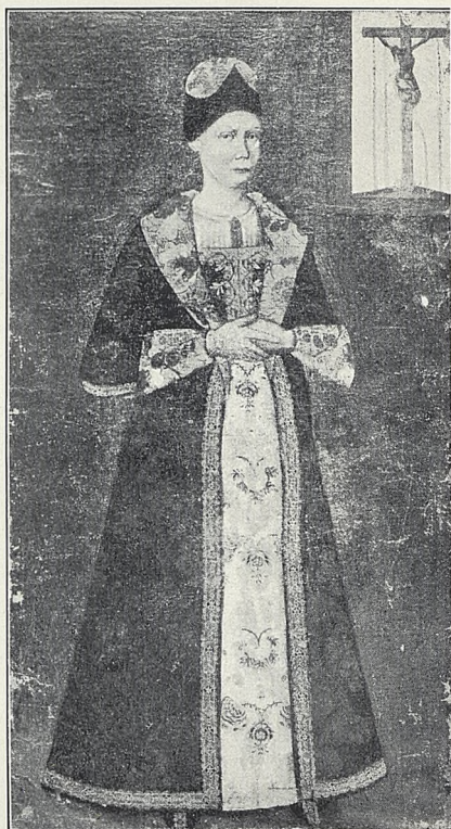
Fig. 3. Malarz nieznan. Portret Mazepiny.

kazało się, że kolekcja Sefera Paszy przedstawia niezwykłą wartość zarówno pod artystycznym jak i materialnym względem. Zwłaszcza zbiór kling damasceńskich należy do największych w Europie. Komitet muzealny oceniając rezultat i doniosłość pracy p. Ksawerego Saryusz Zaleskiego, wyraził mu uznanie i podziękowanie. Prace konserwacyjne nad starymi drukami uległy chwilowej przerwie, gdyż zbiory te nagromadzone w Muzeum im. E. Hutten Czapskiego, znajdują się teraz w stadium porządkowania.