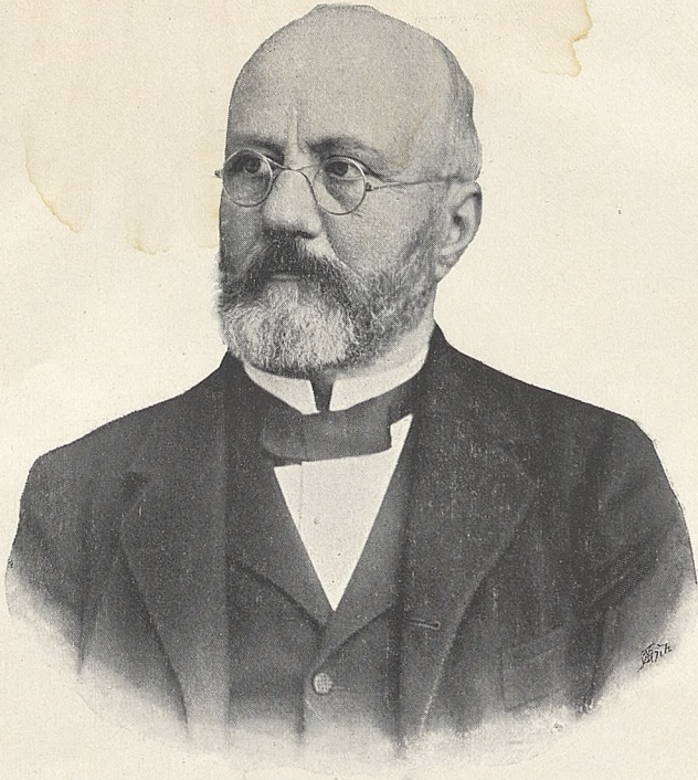
DR. HENRYK JORDAN.