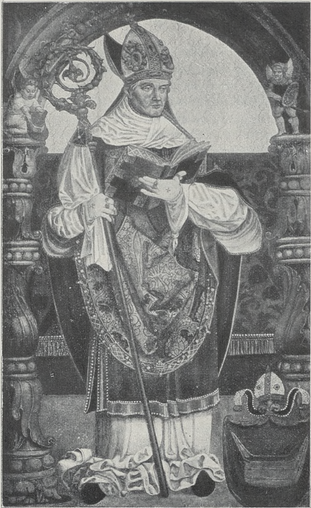
Fig. 1. HANS DÜRER: PORTRET BISKUPA PIOTRA TOMICKIEGO (Krużganki OO. Franciszkanów w Krakowie).