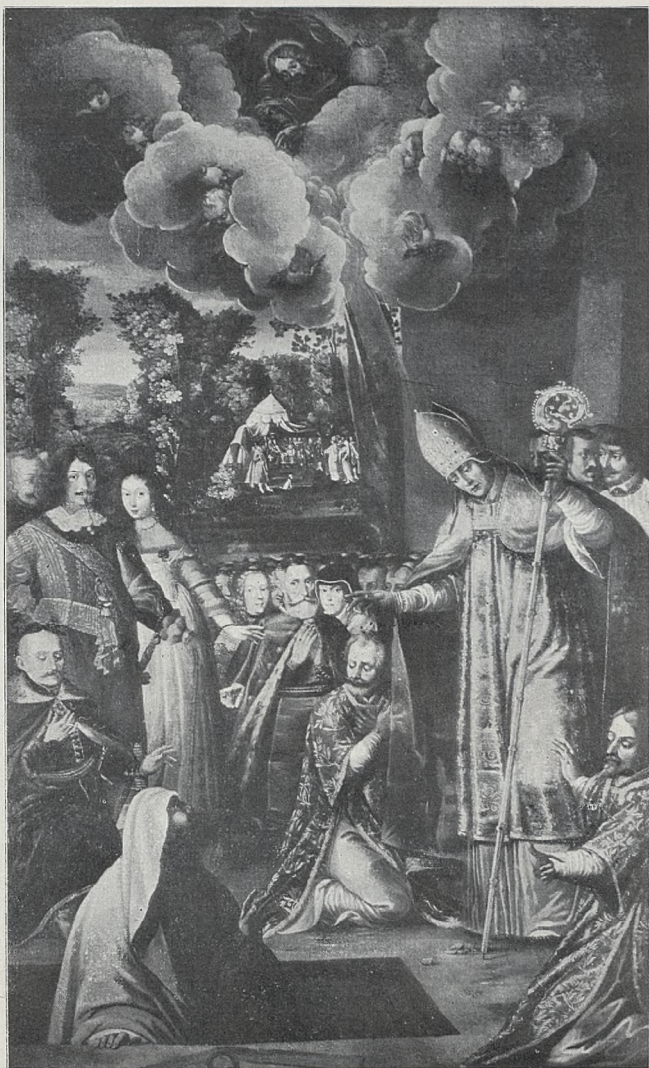
Fig. 2. WSKRZESZENIE PIOTROWINA (Kaplica Oświęcimów kościoła OO. Franciszkanów w Krosnie).