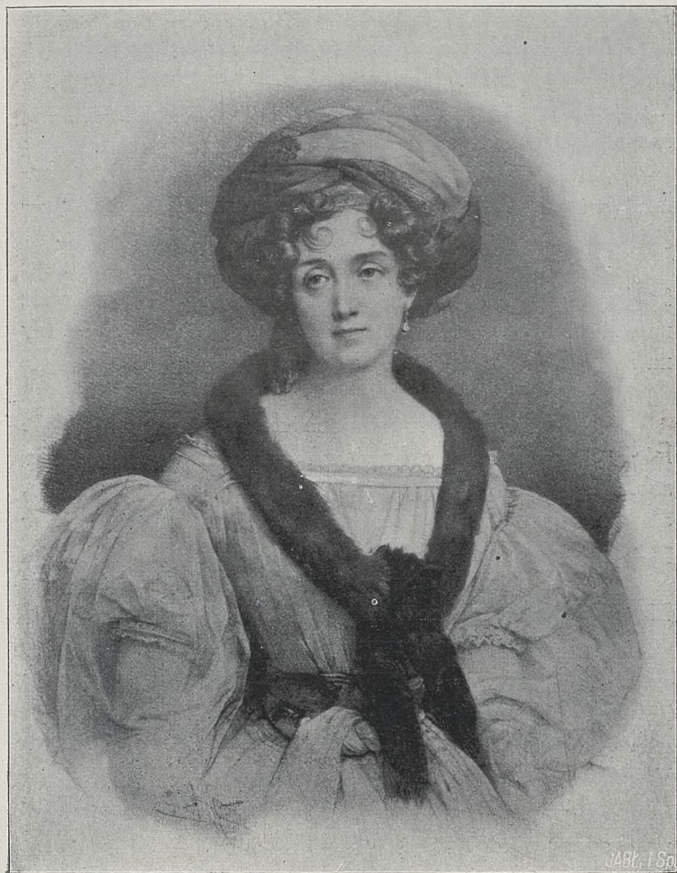
Fig. 7. ZOFIA Z CZARTORYSKICH ZAMOYSKA według ryciny B. Grevedona.