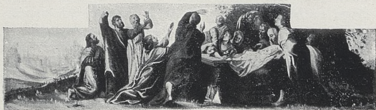
Fig. 3—4. WNIEBOWZIĘCIE N. P. MARYI (tympanon i predella obrazu „Wskreszenie Piotrowina“ w kaplicy Oświęcimów kościoła OO. Franciszkanów w Krosnie).