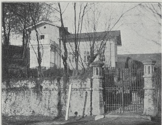
Fig. 8. DWOREK „POD LIPKAMI“ NA ZWIERZYŃCU.

1813-tym przyszła w jej posiadanie — nie mamy pod tym względem dokładnych wiadomości. Jenerał Władysław Zamoyski, czwarty z rzędu z jej synów, a ojciec żyjącego dziś hr. Władysława Zamoyskiego w Kuźnicach, w wydanych niedawno przez Zakład Kórnicki wspomnieniach*) pisze, że była tu mała zagroda, i że matka jego, polubiwszy to ustronie, nabyła je, a dawnego właściciela osadziła na