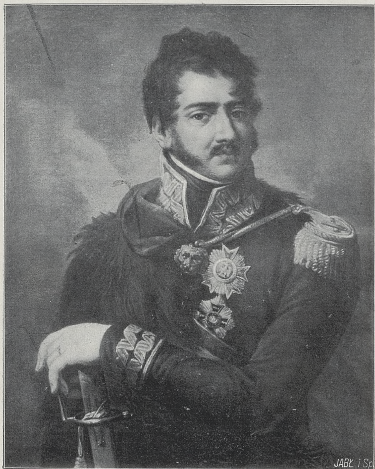
Fig. 6. KSIĄŻĘ JÓZEF PONIATOWSKI według portretu M. Bacciarellego. (Własność Karola hr. Lanckorońskiego w Wiedniu).