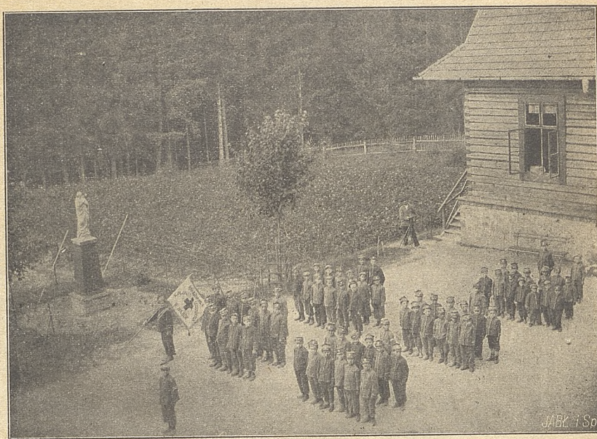
CHŁOPCY WYCHODZĄ Z KOLONII NA ĆWICZENIA I DALSZĄ PRZECHADZKĘ