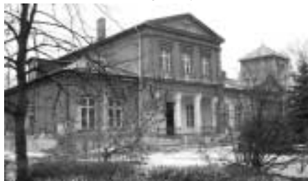
Dwór Cieczów (ok. 1820 r.)