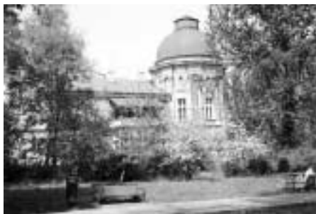
Pałac Jerzmanowskich (1891 r.)

Prokocim włączono do Krakowa w 1941 r. Po II wojnie światowej mieszkało tu 7 500 osób, z których ok. 80 proc. stanowili kolejarze i ich rodziny, stąd potocznie osiedle nazywano „kolonią kolejarską”. Na terenie Dzielnicy znajdują się także obiekty KLS „Kolejarz-Prokocim”. W latach