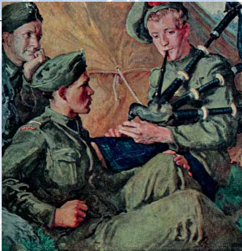
A Polish Artist