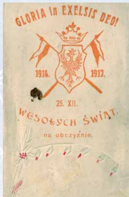
■ Okolicznościowa kartka świąteczna z wydoczonym motywem ozdabiającym w dolnej części.

Ty, Święta Mateczko, utul Swe dziecię. No, bo mróz okrutny, wiatr śniegiem miecie. Niech siankiem okryty w źłóbeczku leży. Na co ma tak marznąć, jak my żołnierze.