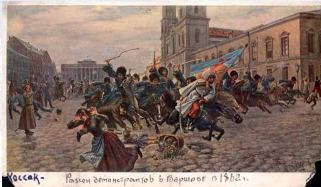
■ Wojciech Kossak, Z mojego dzieciństwa

Ach, to Maria w bólach rodzi, Bóg się rodzi! Bóg się rodzi!