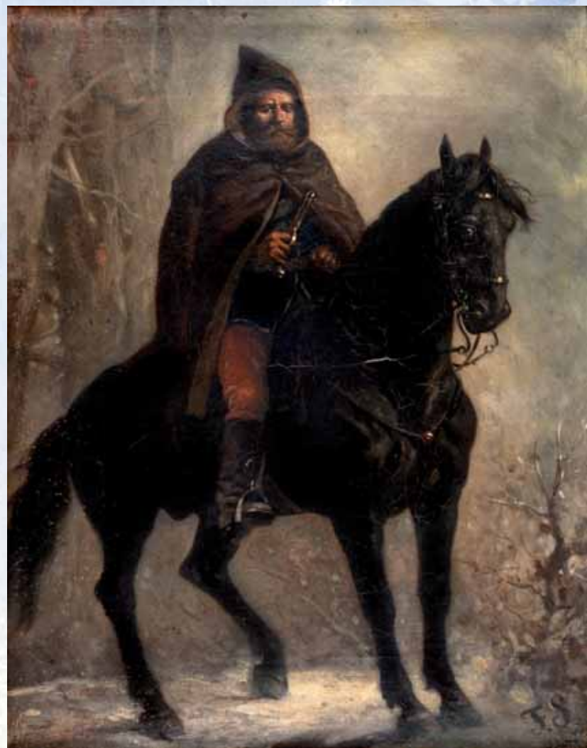
■ Feliks Sypniewski, Powstaniec na koniu .

Upadek powstania i carskie represje nie odwróciły chłopów od niesienia pomocy ukrywającym się powstańcom, czczenia pamięci poległych i pielęgnowania grobów wbrew carskim zakazom. Powstanie styczniowe, jak żadne wcześniejsze, rozbudziło wiarę chłopów we własne siły. Pozwoliło uświadomić chłopom fakt niezwykle doniosły, że potrafią sami dowodzić i prowadzić walkę z zaborcą, a nawet odnosić zwycięstwa w potyczkach z wojskiem.