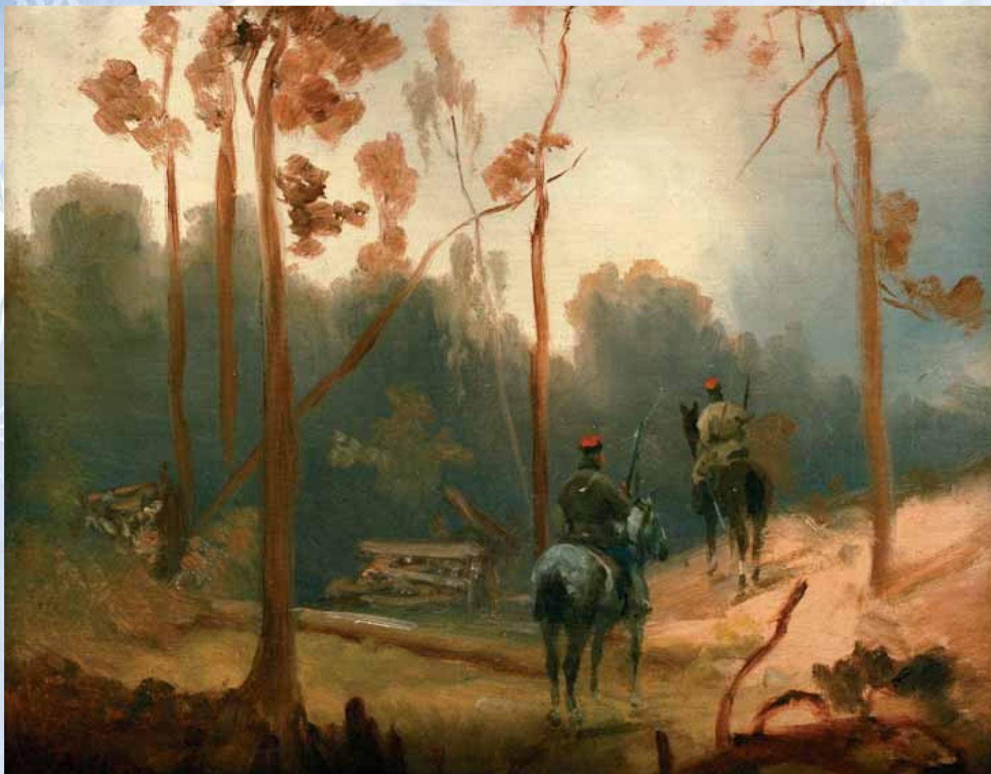
■ Maksymilian Gierymski, Czaty .