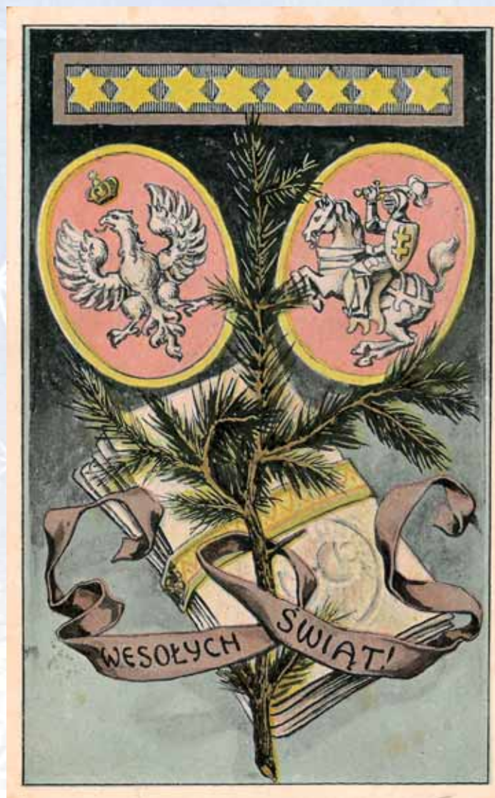
■ Poczłówka świąteczna wysłana z terenu zaboru niemieckiego.

I ci do reszty, nie tracąc chwili, Wroga Moskala precz wypędzili, Za co niech Ci chwała będzie Przy tegorocznej kolędzie, Jezu kochany!