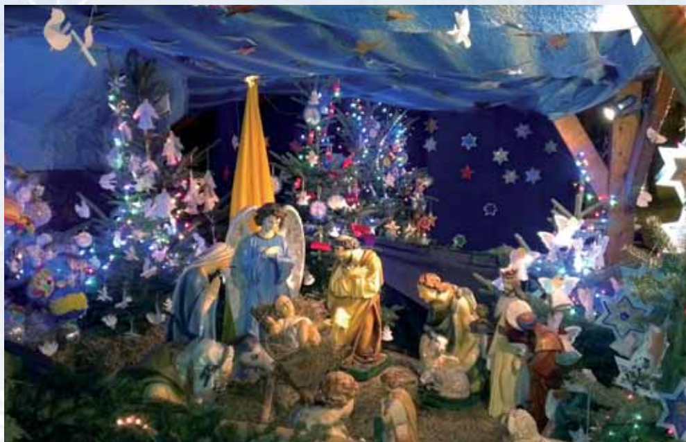
■ Szopka „Betlejemka” wykonana jak co roku przez rodziców Dzieci Komunijnych z parafii p.w. św Mikołaja w Bochni. (2012)

Trzej Królowie, monarchowie Wschodni kraj opuszczają, Serc ofiary z trzema dary Tobie, Panu, oddają, „Darami się kontentuję, Bardziej serca ich szacuję, Za co niebo niech mają”.