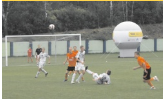
Wydarzenia sportowe, str. 6