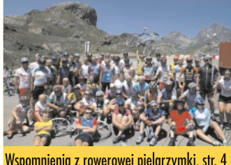
Wspomnienia z rowerowej pielgrzymki, str. 4