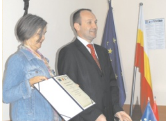
Środki na działania lokalne, str. 3