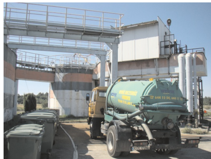
Osad z oczyszczalni jest bezpieczny.

Reasumując: jeżeli osad z oczyszczalni nie przekracza dopuszczalnych norm, a taki jest osad wolbromski, można go wykorzystywać jako składnik glebotwórczy. Osad nie jest niebezpieczny dla środowiska, co jest potwierdzone badaniami wykonywanymi przez akredytowane laboratorium w Katowicach co najmniej 2 razy w roku. Oczywiście można go w całości wywozić do utylizacji, nie pozostawiając w okolicy