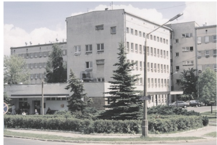
Tylko Olkusz przeciwny prywatyzacji szpitala.

Jak już pisaliśmy – dyrekcję szpitala przejął już nowy menadżer, rekomendowany przez Grupę Nowy Szpital. Ostateczna umowa w sprawie przekształcenia ZOZ między Powiatem, a spółką Nowy Szpital zostanie podpisana już po zakończeniu procesu konsultacji, zawiązaniu spółki Nowy Szpital