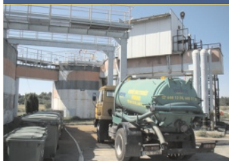
Fakty o osadzie z oczyszczalni, str. 2