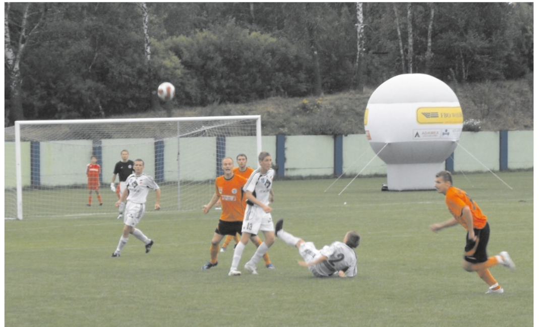
Zawodnicy Przeboju szczęśliwie zremisowali.

W pierwszych minutach spotkania żadna z drużyn nie zdobyła zdecydowanej przewagi na boisku. Mimo kilku groźnych akcji w wykonaniu obu zespołów wynik bezbramkowy utrzymał się do przerwy. W drugiej części spotkania do ataku rzuciła się drużyna gości. W 54 minucie spotkania, po dośrodkowaniu z rzutu różnego do piłki w polu karnym dobiegł Radzio i w zamieszaniu pokonał Palczewskiego. W 68 minucie świetny rajd prawą stroną przeprowadził Nagaoka. Na wysokości pola karnego dośrodkował do Derejczyka, a ten pokonał bramkarza gości. Zawodnicy Przeboju wystąpili bez czterech podstawowych zawodników i, jak ocenia mecz An-