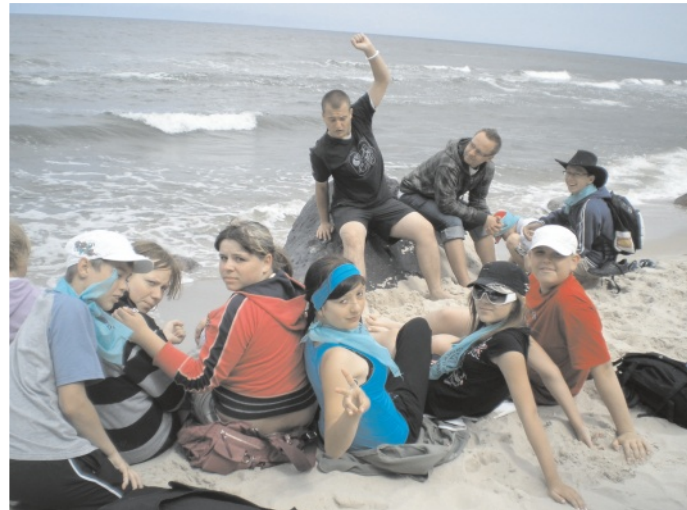
Wypoczywali z Bogiem.

Dzieci korzystały z kąpeli morskich i słonecznych, rozgrywały mecze siatki plażowej i uprawiały inne dyscypliny sportu. Była także okazja, by wyruszyć pieszo brzegiem morza do Międzyzdrojów i w przeciwnym kierunku do latarni „Kikut”, a także popływać kajakami, łódkami i rowerami wodnymi po jeziorze Wisielka, naj-