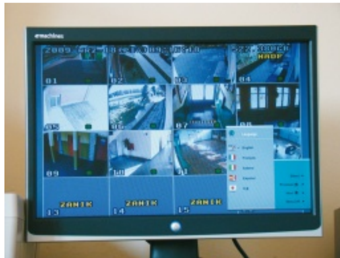
W Zespole Szkół w Dłużcu zamontowano 12 kamer

Niedawno monitoring uruchomiono w Zespole Szkół w Dłużcu. W budynku szkoły zamontowano między innymi sześć kamer zainstalowanych na zewnątrz budynku, sześć kamer umożliwiających rejestrację zdarzeń w rozdzielczości wystarczającej na identyfikację osób wewnątrz budynku, rejestrator i monitor wraz z oprzyrządowaniem. Jest to już piąta w naszej gminie placówka szkolna objęta rejestracją wizualną. W latach 2007-2008 monitoring otrzymało Gimnazjum nr 1, Szkoła Podstawowa nr 1, Zespół Szkół (Pod Lasem), oraz Zespół Szkół w Wierchowisku. Projekt, dzięki któremu uzyskana została przez Gminę dotacja w wysokości 1150 złotych, na wniosek burmistrza Jana Łaksy, sporządzili pracownicy Wydziału Edukacji, Kultury, Sportu i Ochrony Zdrowia Tadeusz Rams i Grzegorz Sypień. Pozostałą kwotę, czyli blisko 15 tysięcy pokrył budżet gminy. Warto dodać, iż kwota 1150 złotych była maksymalną, jaką Gmina mogła otrzymać na monitoring w bieżącym roku. Łącznie, z programu rządowego „Monitoring wizyjny w szkołach i placówkach” na monitoring w pięciu