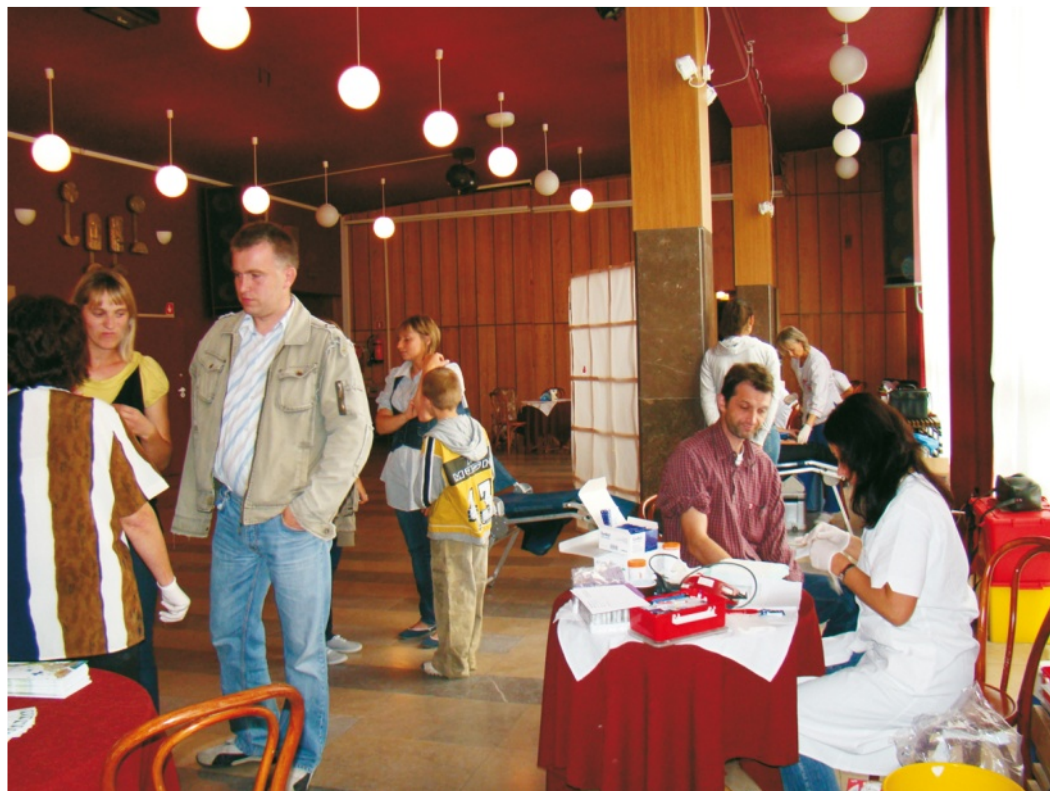
Na sali lustrzanej Centrum Kultury można było oddać honorowo krew i próbki do banku szpiku kostnego

Według statystyk z sierpnia br. aktualnie na przeszczepie czeka 2046 osób, w tym najwięcej na nerki (1604) i serce (200). Główny problem stanowią nie tylko pieniądze, ale i brak narządów. Niektóre z nich: nerki, segmenty wątroby lub tkanki (szpik kostny) można pobierać od osób żywych, jeśli wyrażą na to zgodę, inne - od osób zmarłych, u których stwierdzono komisyjnie śmierć mózgu. Niedostateczna liczba żywych dawców oraz sprzeciw na pobranie narządów, wyrażany przez rodzinę zmarłego, powodują, że nie można uratować życia wielu chorym, dla których jedyną nadzieją jest transplantacja. Kościół popiera transplantacje, Jan Paweł II pisał: „Każdy przeszczep ma swoje źródło w decyzji o wielkiej wartości etycznej; decyzji, aby bezinteresownie ofiarować część własnego ciała z myślą o zdrowiu i dobru innego człowieka”. Przed propagatorami transplantacji ciągle jeszcze wiele pracy, która pomoże zmienić świadomość społeczeństwa i przekonać je o skuteczności tej metody leczenia.