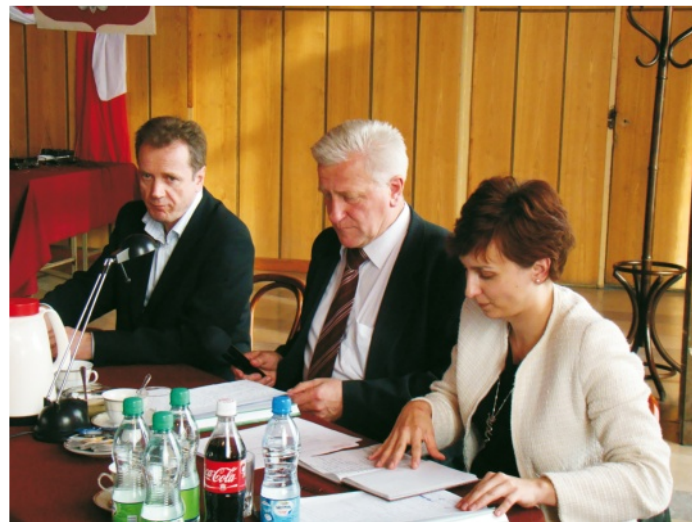
Na pytania radnych odpowiadają burmistrz lub jego zastępca, a także kierownicy odpowiednich komórek merytorycznych.