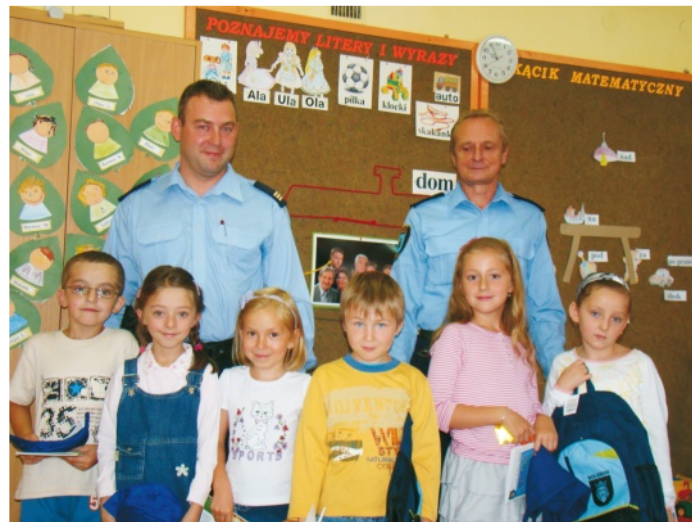
Laureaci konkursu rysunkowego w Zarzeczcu

do kolorowania oraz zawieszki odblaskowej, do noszenia na ubraniu lub tornistrze. Mamy nadzieję, że