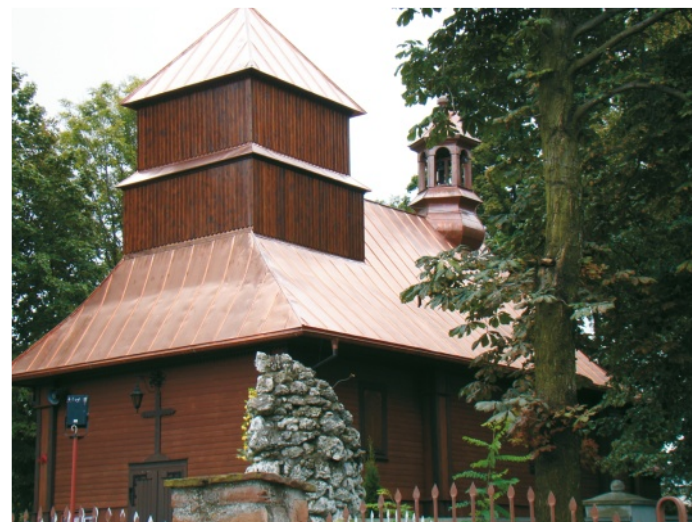
Odrestaurowany kościół łśni nawet w pochmurny dzień.

Kultury, Sportu i Ochrony Zdrowia, którzy pomogli Parafii sporządzić projekt konkursowy. Warto zaznaczyć, iż w ubiegłym roku dzięki pomocy pracowników UMIG dotację na renowację kościoła pw. św. Marcina otrzymała Parafia w Porębie Dzierżnej. Parafia ta otrzymała wtedy dwukrotnie dotację w wysokości 20. i 50. tysięcy złotych. Z kolei kilka lat wcześniej, dzięki wsparciu gminy udało się pozyskać fundusze na gruntowną modernizację innego zabytku na szlaku Architektury Drewnianej - wolbromskiego kościółka modrzewiowego pw. NMP przy ulicy Mariackiej.