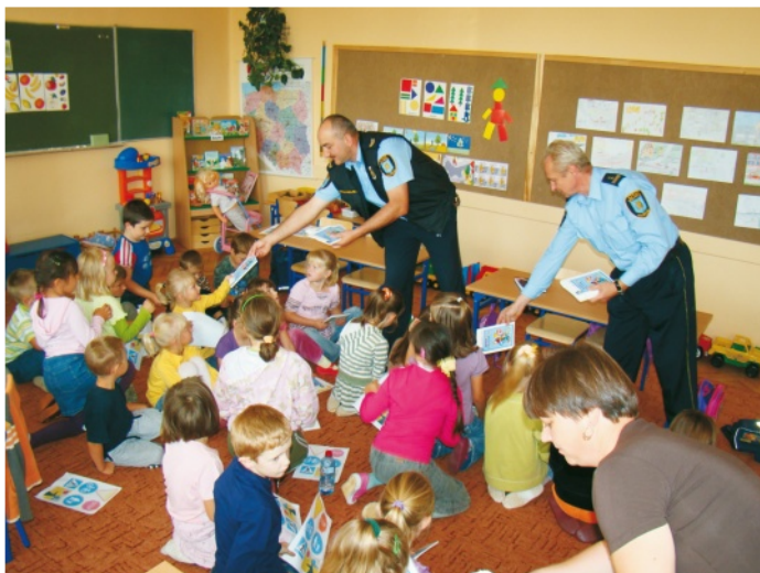
Strażnicy rozdali dzieciom zestawy edukacyjne i odblaski

Pracownicy Straży Miejskiej, prowadzili zajęcia uświadamiające dzieciom zagrożenia, jakie mogą spotkać na drodze oraz znaczenie, jakie ma zachowanie podstawowych zasad, poprawiających bezpieczeństwo: bycie widocznym na drodze (używanie na co dzień odblasków, a także innych zabezpieczeń, np. kasków rowerowych). Przy okazji wizyt w szkołach strażnicy wylaniali zwycięzców i nagradzali autorów najpiękniejszych prac w ogłoszonym z tej okazji konkursie rysunkowym. Gmina Wol-