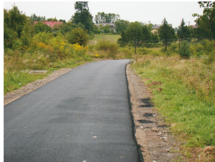
Nowy asfalt w Jeżówce

wierzchni dróg, stanowiących dojazd do gruntów rolnych objął w tym roku modernizacje dróg: w Domaniewiczach wyasfaltowano drogę „do Zawady”, 0,105 km i „do Szota” - na odcinku 0,245 km, w Jeżówce nowy asfalt ułatwia przejazd przez tzw. „Zakoleje” na odcinku 0,275 km, w Brzozówce - położono asfalt na odcinku 0,212 km „Nowej”, w Wierchowisku utwardzono tłuczniem 0,385 km „Cieplonki” oraz w Kąpielach Wielkich tzw. „Kamionki” na odcinku 0,426 km.