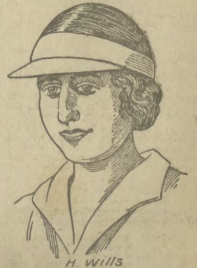
Miss Helena Wills, siedemnastoletnia Amerykanka z Kalifornii pokonała w meczu tenisowym szampionkę Ameryki miss Mallory. Miss Wills jest uważana za jedyną przeciwniczkę, zdolną pokonać szampionkę światową tennisa, paninę Zuzannę Senglen.