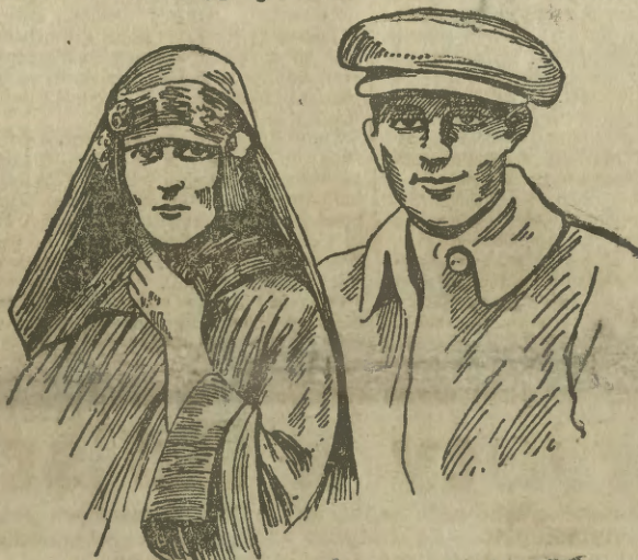
Natasza Rambowa, R. Valentino.

Donosiliśmy niedawno, że Adonis filmowy, najpiękniejszy aktor kinowy w Ameryce, cel westchnień wszystkich pań i paniątek — R. Valentino poślubił uroczą artystkę dramatyczną Nataszę Rambow.