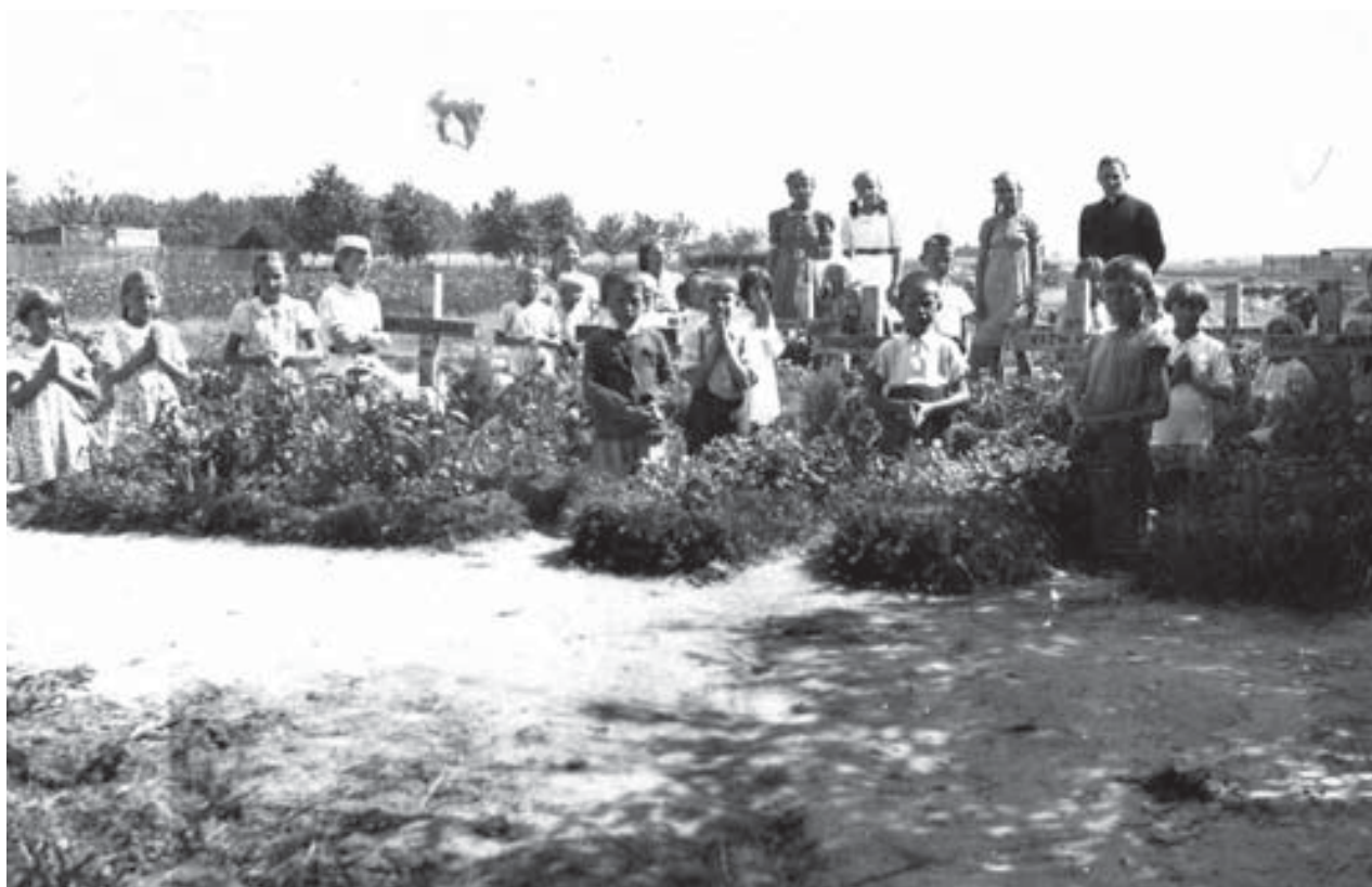
Mogiła żołnierzy poległych we wrześniu 1939 r. Pruszków, zbiory Muzeum Niepodległości w Warszawie, nr inw. F-8289