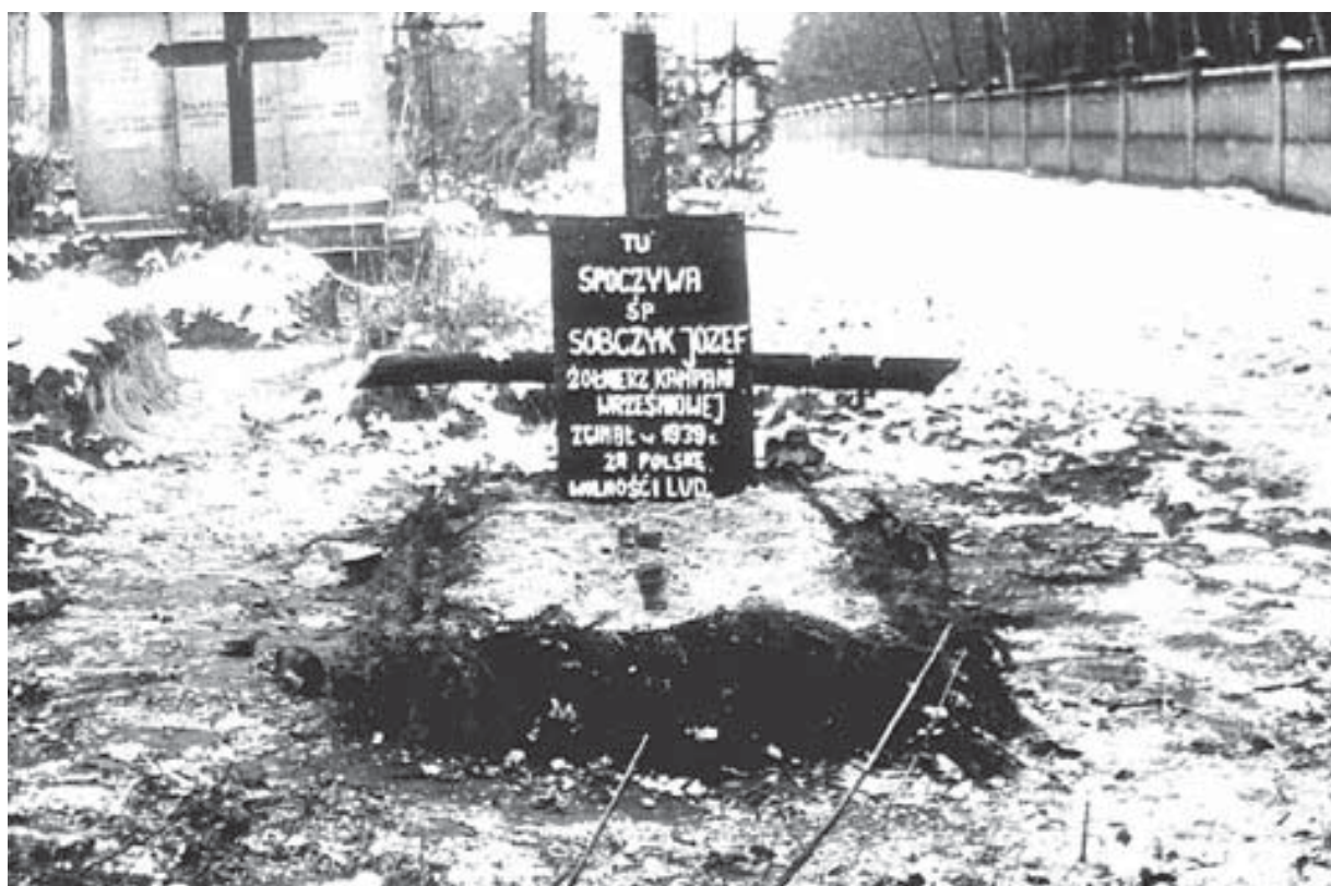
Grób Józefa Sobczyka na cmentarzu parafialnym w Drwalewie.