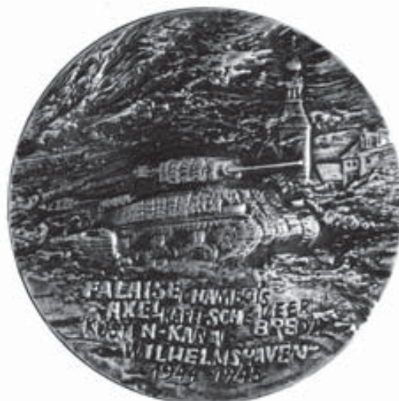
Medal ku czci gen. Stanisława Maczka, wyemitowany w 1987 r. przez Polskie Towarzystwo Archeologiczne i Numizmatyczne. Ze zbiorów Muzeum Niepodległości (nr inw. E 16386).