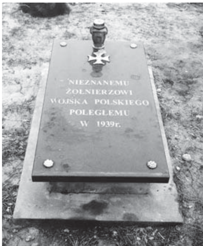
Święte Miejsce. Grób nieznanego żołnierza.