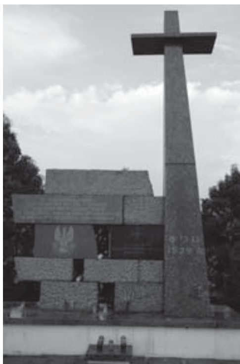
Pomnik na cmentarzu w Wieliszewie.