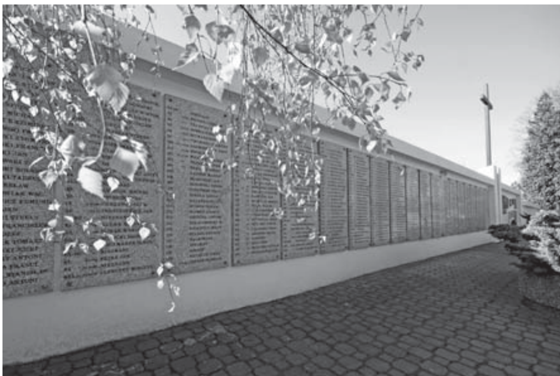
Łęczyca (cmentarz katolicki). Południowa ściana kwatery wojskowej żołnierzy polskich poległych w bitwie nad Bzurą w dniach 9-14 września 1939 r.