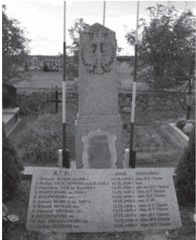
Kwata poległych żołnierzy WP z Września 1939 r. w Mińsku Mazowieckim.