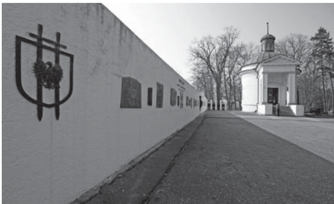
Kutno (Park Wiosny Ludów). Muzeum Bitwy Nad Bzurą – „Mur Pamięci” z tablicami upamiętniającymi formacje biorące udział w walkach.