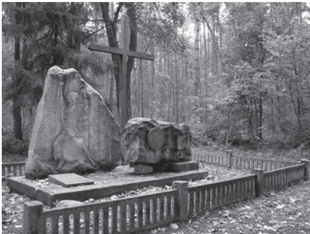
Gašno (las). Pomnik powstańców styczniowych poległych w 1863 r. na terenie powiatu gostyńskiego.