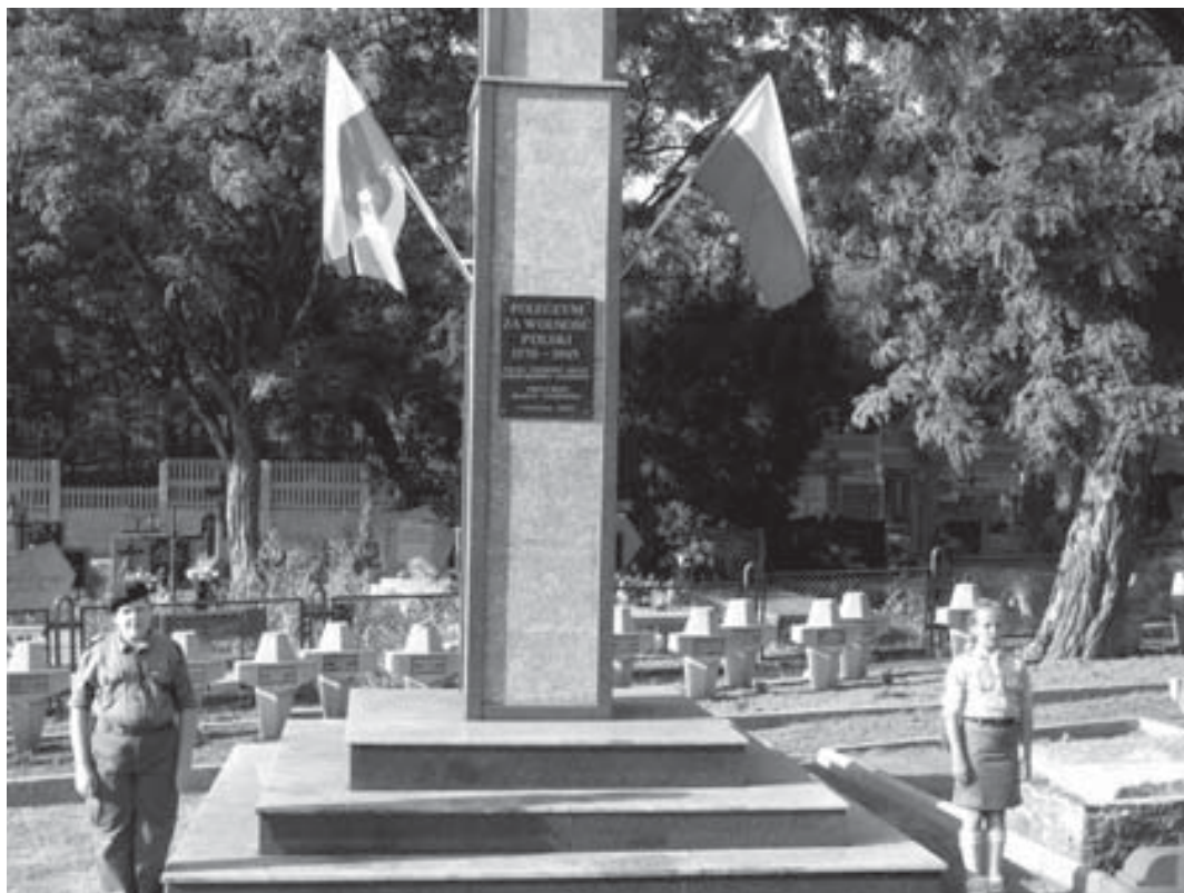
Pomnik na cmentarzu w Legionowie.