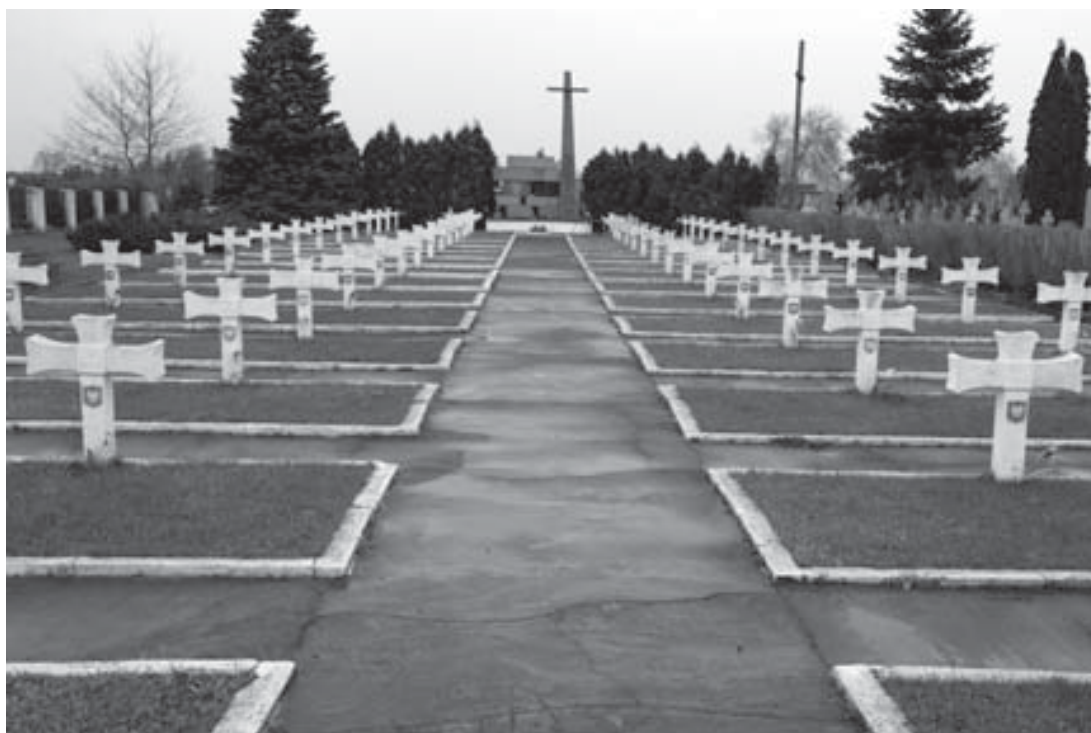
Cmentarz żołnierzy Września 1939 w Wieliszewie.