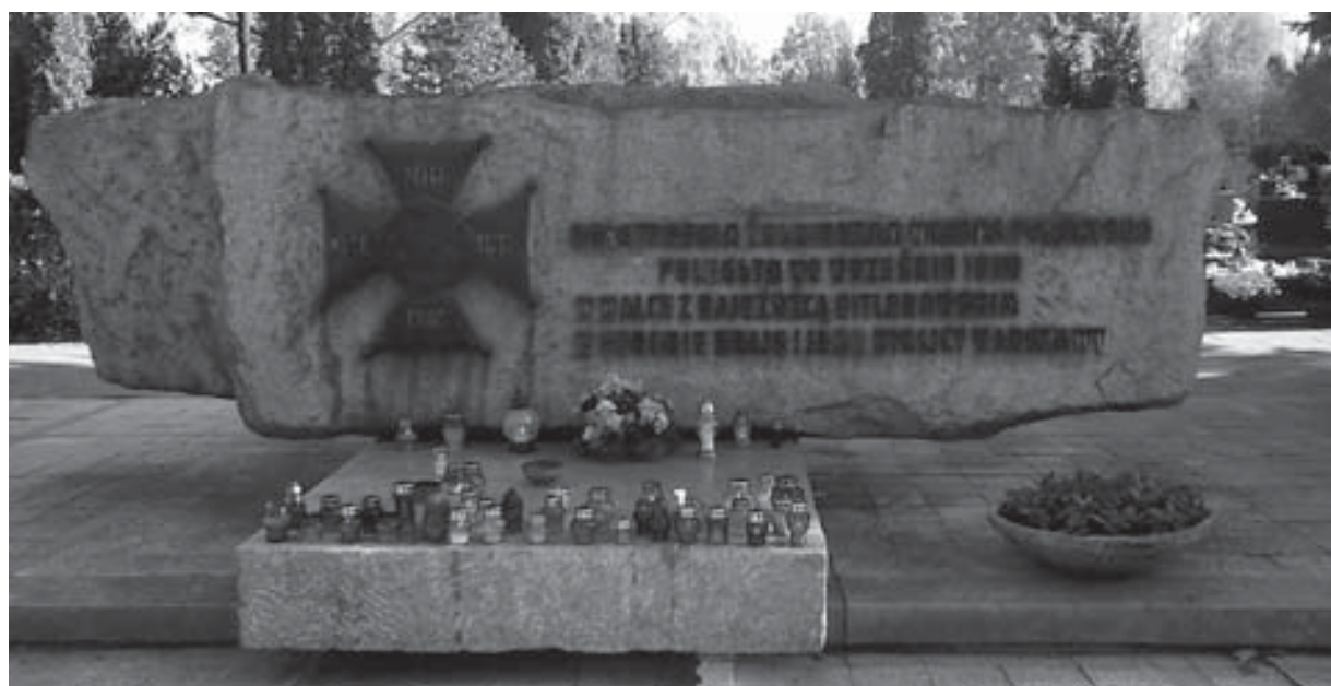
Pomnik upamiętniający poległych żołnierzy we wrześniu 1939 r.