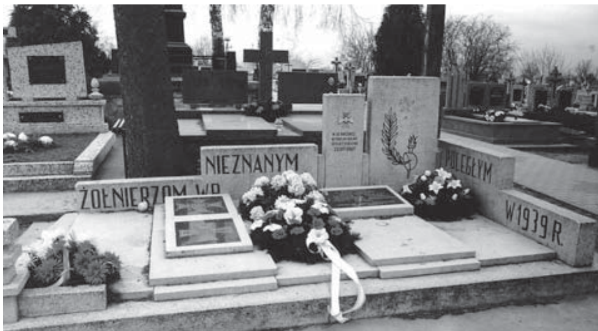
Czernice Borowe. Pomnik na mogile żołnierzy 21. pp Dzieci Warszawy.