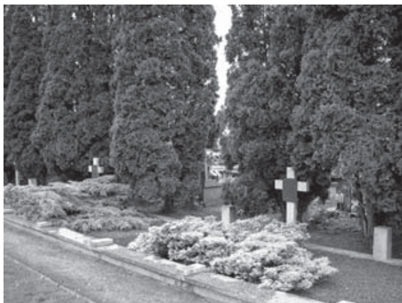
Kwaterna żołnierzy 1 Dywizji Piechoty Legionów im. Józefa Piłsudskiego na cmentarzu parafialnym w Kałuszynie.