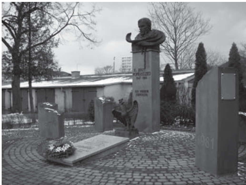
Płock (przy Kościele św. Stanisława Kostki). Pomnik w hołdzie ks. Jerzemu Popiełuszce i ofiarom robotniczych protestów.