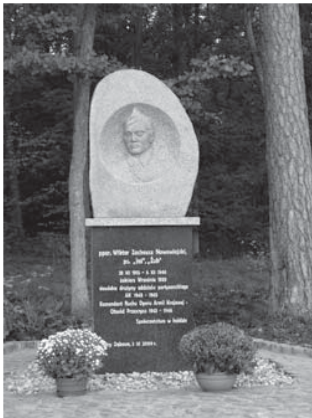
Góry Dębowe. Pomnik Wiktora Zacheusza Nowowiejskiego.