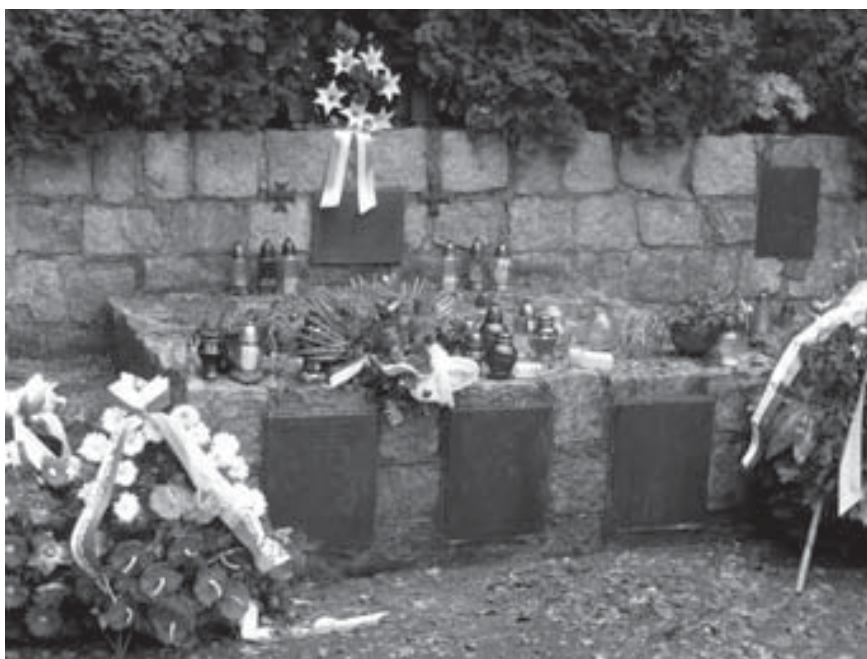
Uroczystość poświęcenia mauzoleum w dniu 26 września 1976 r.

z trudem żołnierskim. Myślę, że nieprzypadkowe było też sięgnięcie po ten autentyczny element pól, na których straciła życie większość pochowanych w tym grobie. Natomiast ścianę pionową zamierzano zestawić z kostki granitowej i na niej umieścić mosiężne tablice. Utrzymano Krzyż Virtuti Militari i dodano drugi – o zarysie Krzyża Walecznych . Na murach wewnętrznych (kamiennych, choć początkowo przewidywano ogrodzenie metalowe), oddzielających mauzoleum od grobów cywilnych, przewidziano miejsce na dwa metalowe stylizowane orły. Pamiętano o dwóch zniczach z brązu w kształcie hełmów piechoty wrześniowej. Tak rozbudowany projekt wymagał znacznych nakładów finansowych. Cieszyły więc dary, między innymi od pruszkowskich zakładów „Inco”, kamieniołomów ze Strzegomia, miejscowych przedsiębiorstw. Bezcenny był również udział księży i wiernych, nie tylko z miejscowej parafii. Zdecydowaną większość prac wykonano własnymi siłami, w tym montaż krzyży. W 1973 r. do mogiły przekształcanej w mauzoleum przeniesiono prochy żołnierzy zmarłych po 14 września 1939 r., spoczywające w odrębnym grobie na omawianym cmentarzu. Całość prac ukończono w 1975 r., by zdążyć na obchody 30. rocznicy zwycięstwa nad Niemcami 19 .