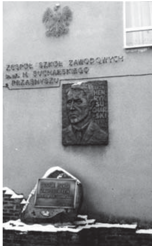
Przasnysz. Zespół Szkół Ponadgimnazjalnych im. mjr. Henryka Sucharskiego, tablice pamiątkowe.