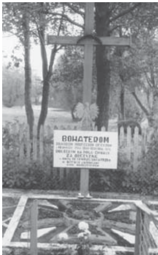
Wspólna mogiła koło cmentarza w Andrzejewie. Lata sześćdziesiąte XX w.