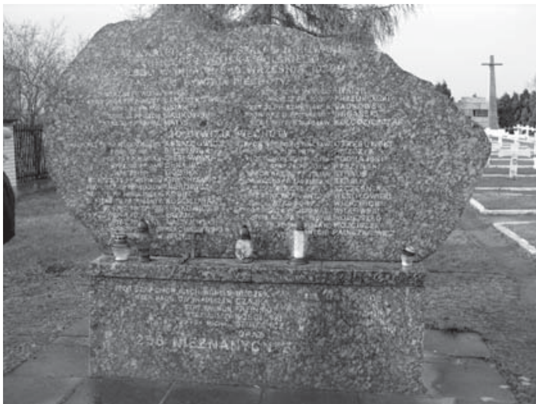
Cmentarz w Wieliszewie – tablica z nazwiskami poległych.