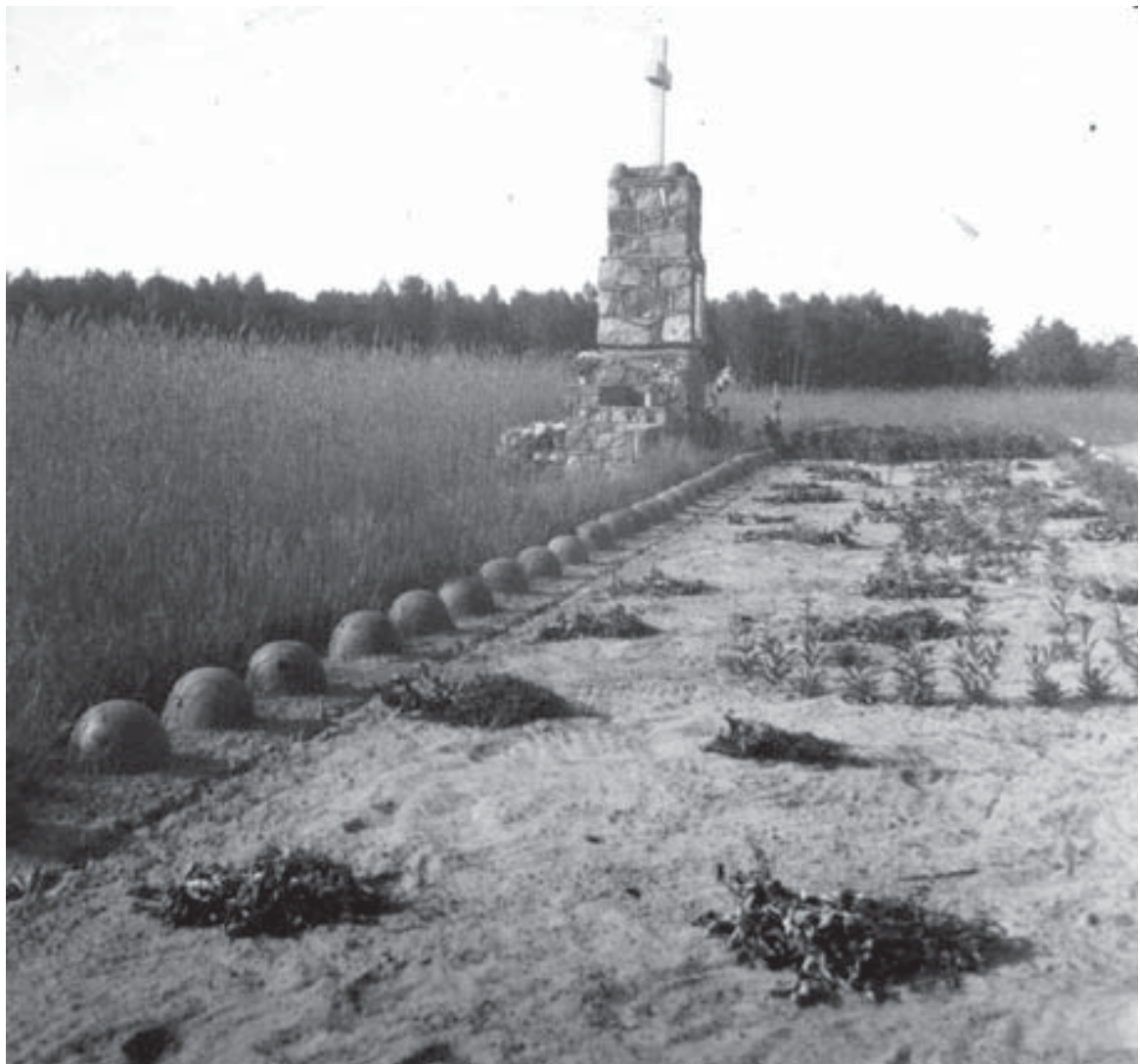
Cmentarze i pomniki Września na Mazowszu