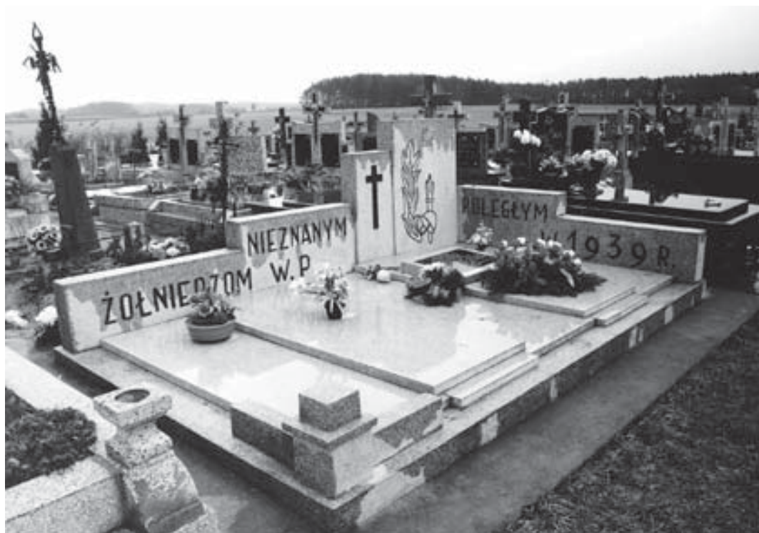
Węgra. Pomnik na zbiorowej mogile żołnierzy Mazowieckiej Brygady Kawalerii.