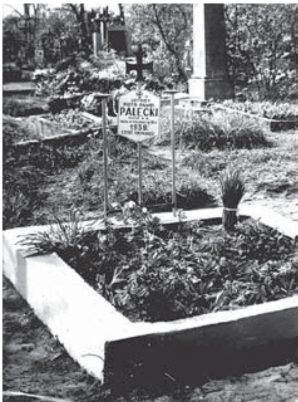
Cmentarz parafialny w Ostrołęce pod Warką. Grób lotników poległych 10 września 1939 r.