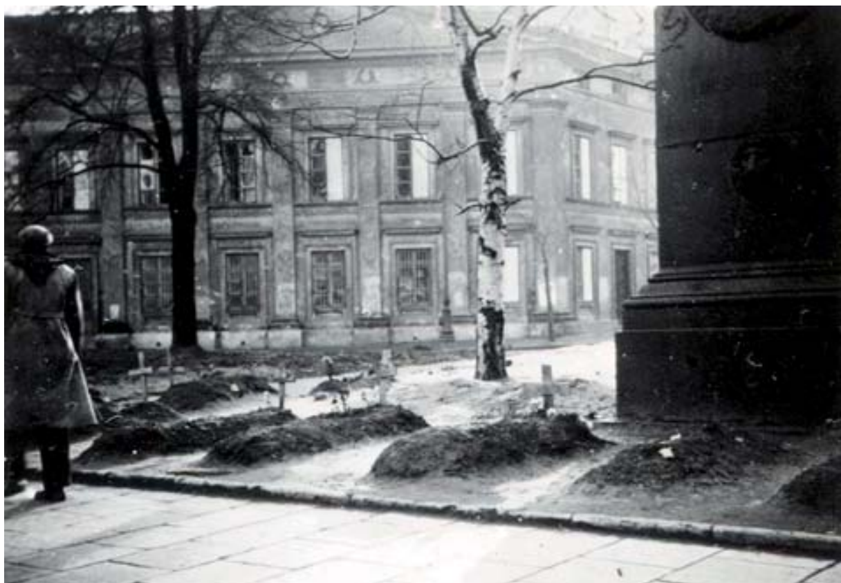
Groby przy skwerze, przy placu Krasieńskich przed Pałacem Rzeczypospolitej. Na pierwszym planie po prawej stronie zabytkowa studnia projektu P. Aignera.

W głębi budynek Archiwum Akt Dawnych, 1939, zbiory Muzeum Niepodległości w Warszawie, 6,5x9 cm, F-2832.