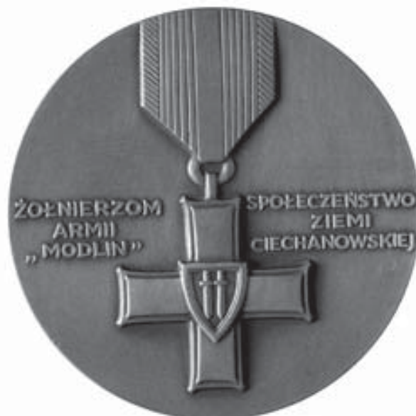
Medal ku czci żołnierzy Armii „Modlin”, wyemitowany w 1985 r. przez Mennicę Państwową. Ze zbiorów Muzeum Niepodległości (nr inw. E 16315).