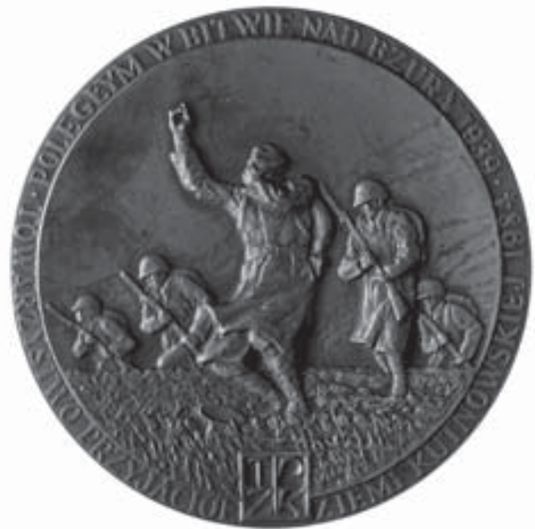
Medal ku czci gen. Franciszka Włada (1888-1939) i poległych w bitwie nad Bzurą, wyemitowany w 1984 r. przez Towarzystwo Przyjaciół Ziemi Kutnowskiej. Ze zbiorów Muzeum Niepodległości (nr inw. E 15550).