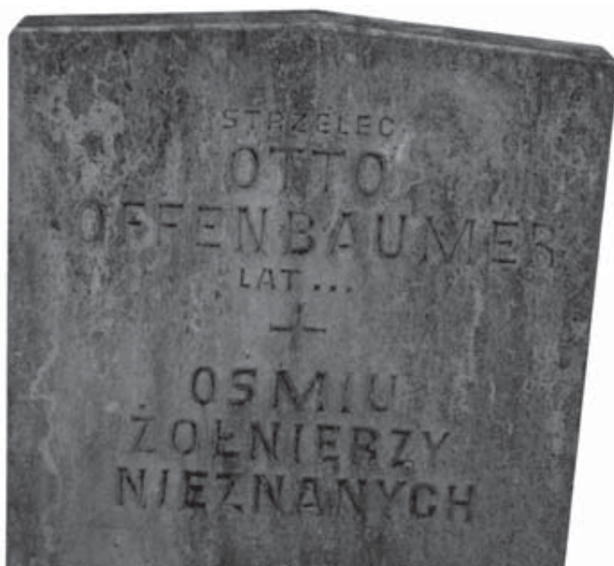
Nagrobek w formie tablicy