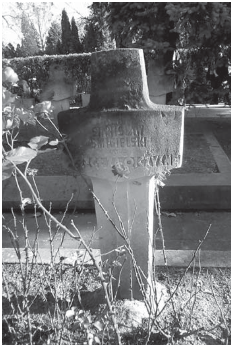
Grób żołnierza poległego w 1939 r. w formie „mieczokrzyża”