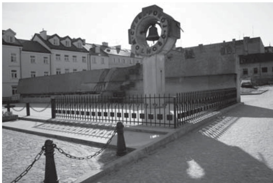
Płock. Plac 13. Straconych. Pomnik upamiętniający miejsce egzekucji w dniu 18 września 1942 r.