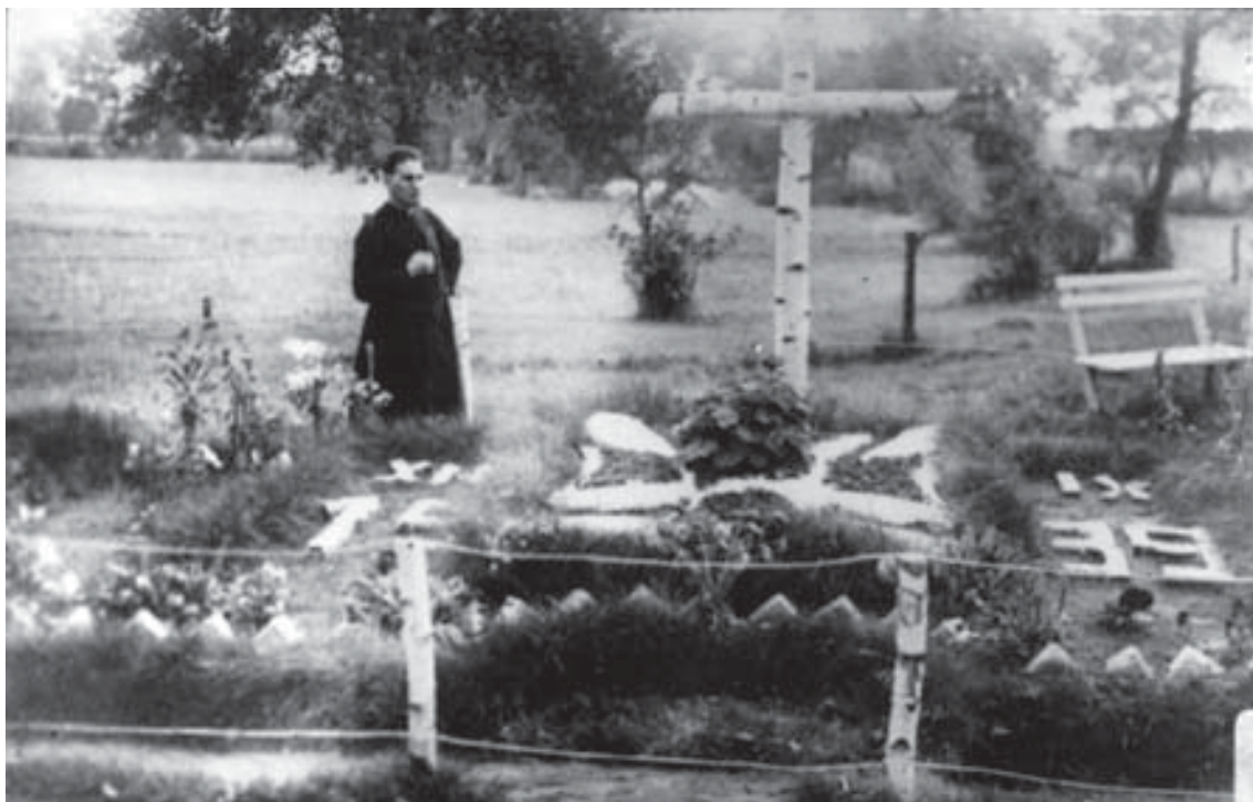
Wspólna mogiła koło cmentarza w Andrzejewie, 1943 r.