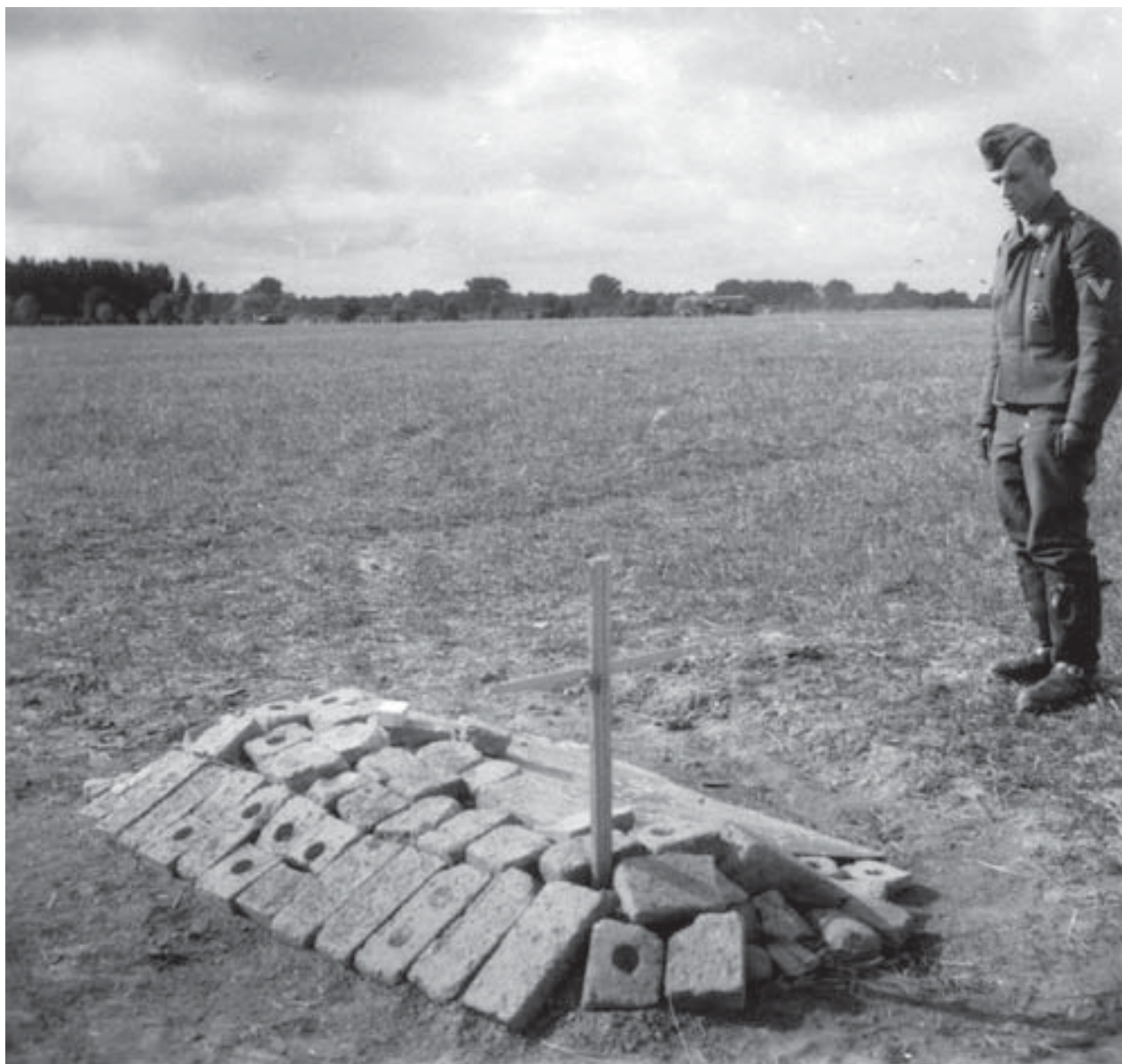
Grób żołnierza niemieckiego na lotnisku w Nowym Dworze. Przy grobie żołnierz w mundurze armii niemieckiej, zbiory Muzeum Niepodległości w Warszawie, nr inw. F-2936