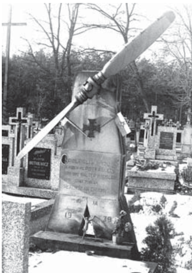
Cmentarz parafialny w Ostrołęce pod Warką. Odświeżony w 1977 r. nowy pomnik na grobie lotników poległych 10 września 1939 r.