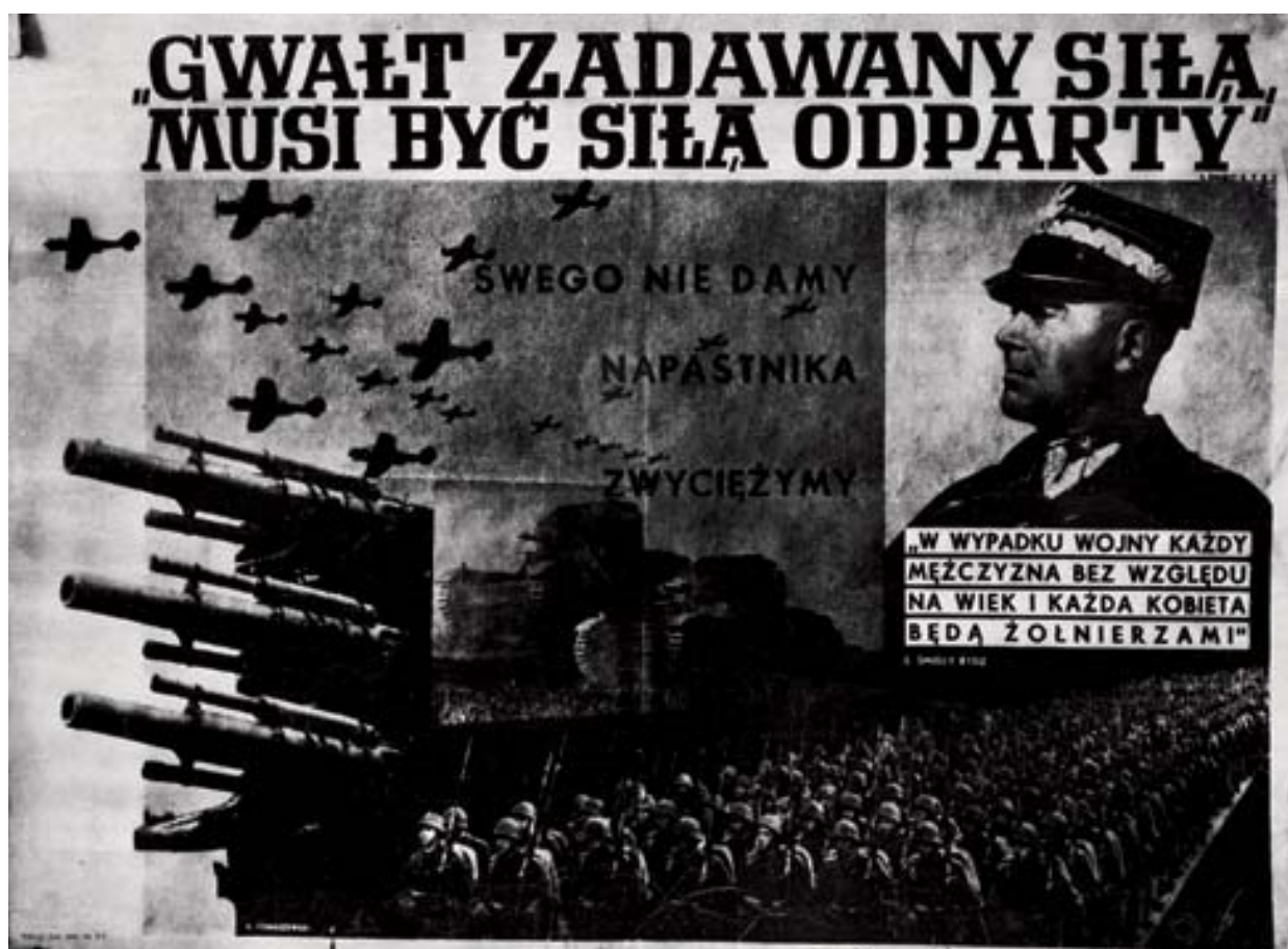
Henryk Tomaszewski, Gwałt zadawany siłą musi być siłą odparty , zbiory Muzeum Niepodległości w Warszawie, 49x67 cm, Pl. 1391