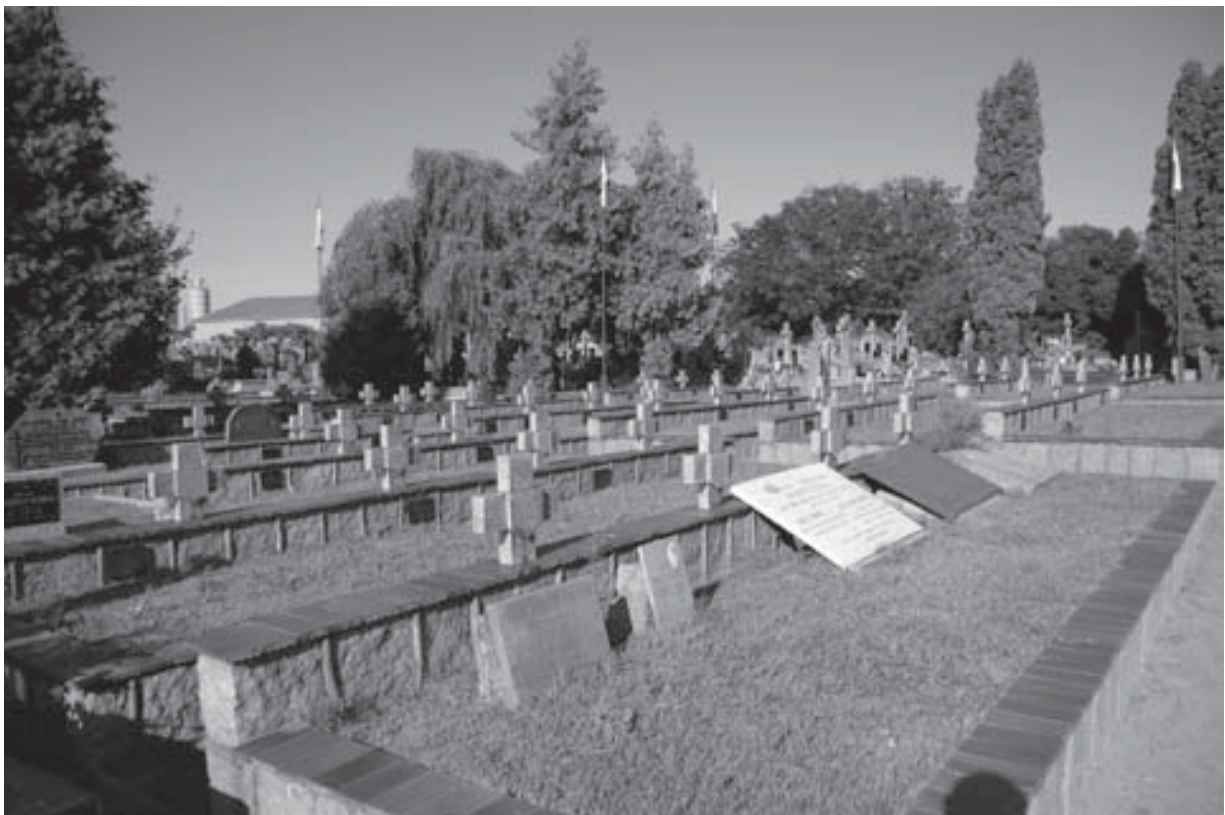
Cmentarz parafialny w Siennicy, zbiorowa mogiła żołnierzy z Września 1939 r.