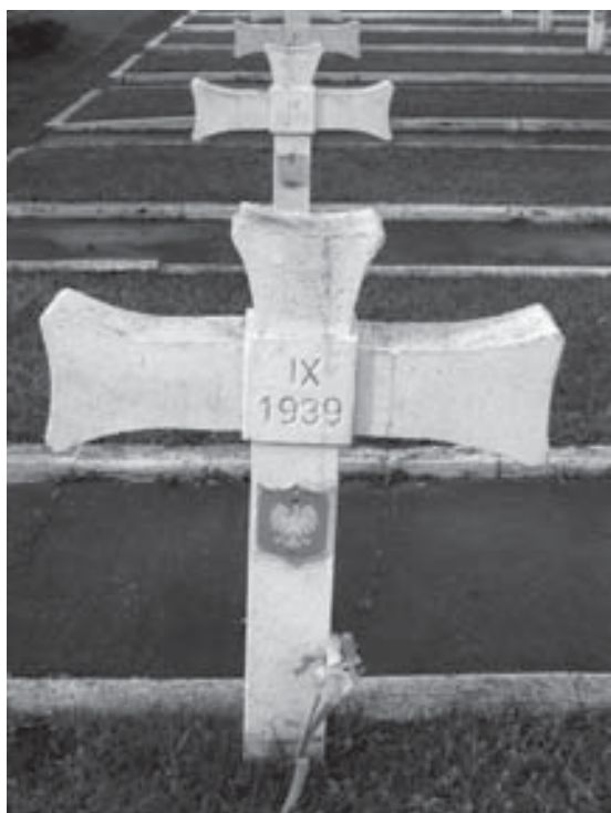
Cmentarz w Wieliszewie – bezimienna mogiła.