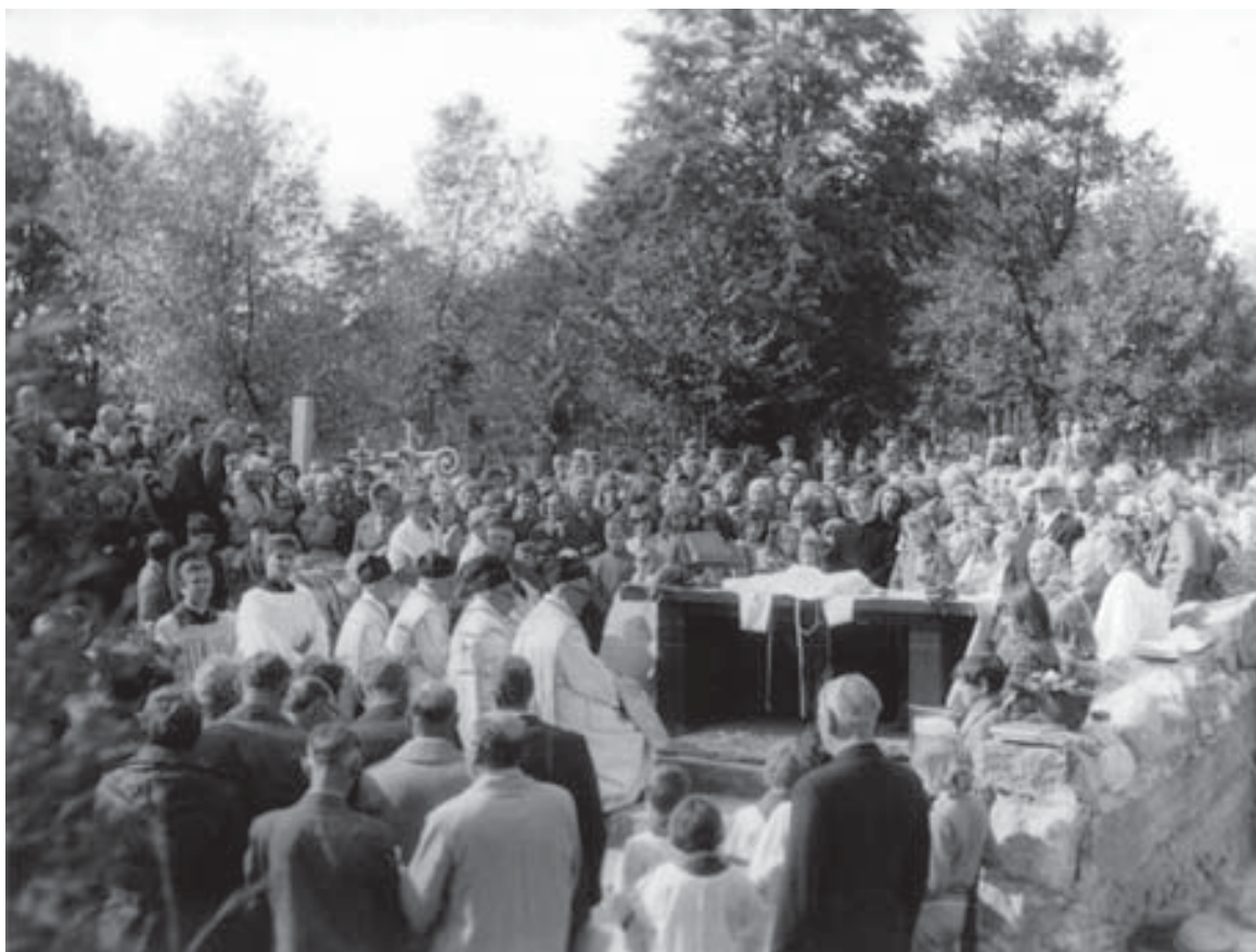
Uroczystość poświęcenia mauzoleum w dniu 26 września 1976 r.