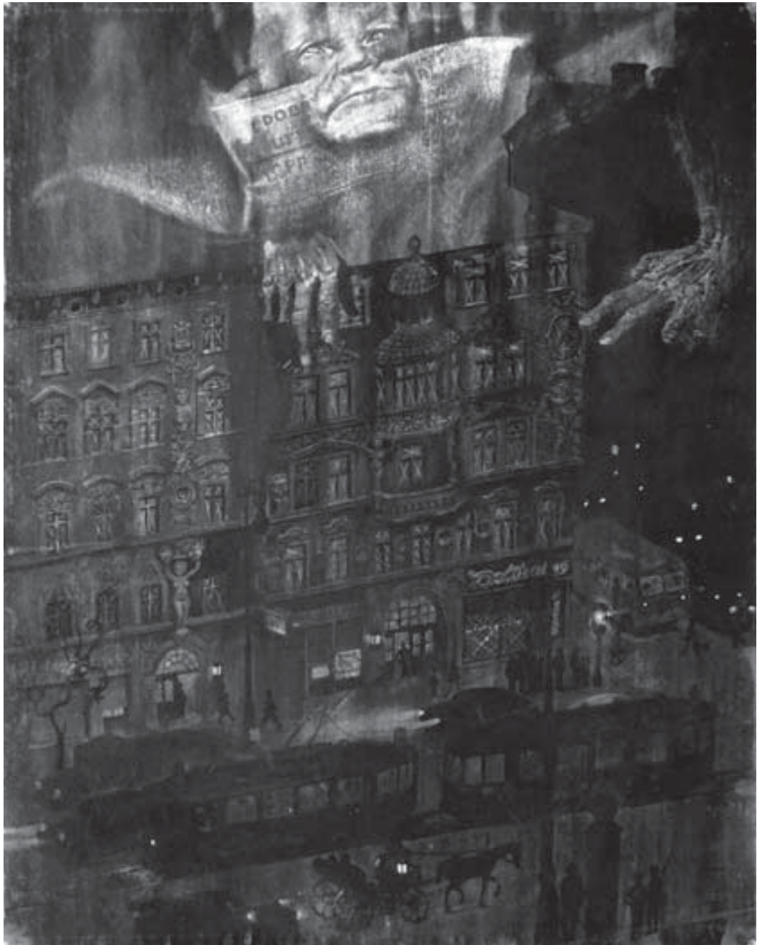
Pamięć Września 1939 w muzealnictwie