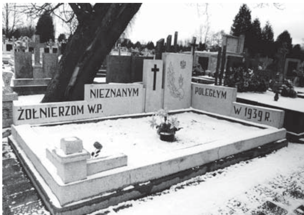
Przasnysz. Cmentarz parafialny, pomnik na zbiorowej mogile żołnierzy Września.