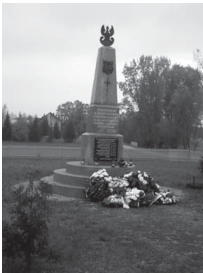
Pomnik w Łętownicy, 2009 r.