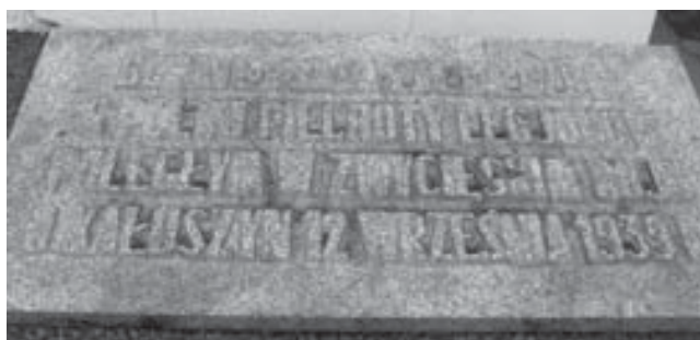
Płyta pamiątkowa ku czci żołnierzy 6 Pułku Piechoty im. Józefa Piłsudskiego na cmentarzu parafialnym w Kałuszynie.