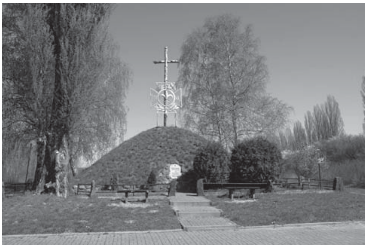
Płock (ul. Targowa). „Bratnia Mogiła” bohaterów obrońców Płocka poległych w walce z bolszewikami 18-19 sierpnia 1920 r.

Powiatowego PSL w Sierpcu, zamordowanego 25 maja 1946 r. przez funkcjonariuszy MO); jak również symboliczne groby, tablice pamiątkowe ku czci ofiar sowieckiego terroru (np. na cmentarzu rzymskokatolickim w Sierpcu) i reżimu okresu stalinowskiego w Polsce (krzyż brzozy na cmentarzu katolickim w Łęczycy, poświęcony pamięci zamordowanych w więzieniu łęczyckim w latach 1945-1956, tablica upamiętniająca osoby zgładzone przez gestapo w latach 1941-1945 i przez NKWD, UB i SB w latach 1945-1989 na budynku Komendy Miejskiej Policji przy ul. 1 Maja w Płocku). Kilka obiektów upamiętnia zdarzenia z najnowszej historii Polski, takie jak robotnicze protesty w Płocku w dniu 25 czerwca 1976 r., zainicjowane przez pracowników Petrochemii czy sprzeciw wobec wprowadzenia stanu wojennego i aresztowań działaczy NSZZ „Solidarność” w dniu 13 grudnia 1981 r. np. głaz z dwoma tablicami przy Bramie nr 2 na terenie Polskiego Koncernu Naftowego Orlen, Pomnik Ofiar Protestów Robotniczych przy Kościele św. Stanisława Kostki w Płocku.