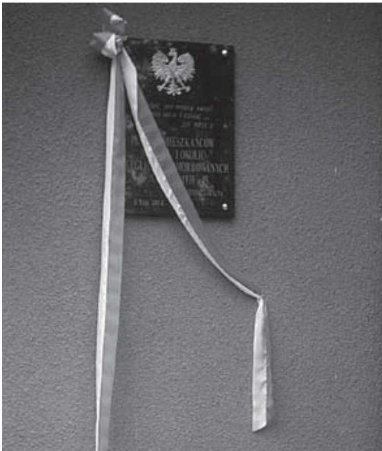
Mchowo. Tablica pamiątkowa na gmachu szkoły w dniu odsłonięcia.