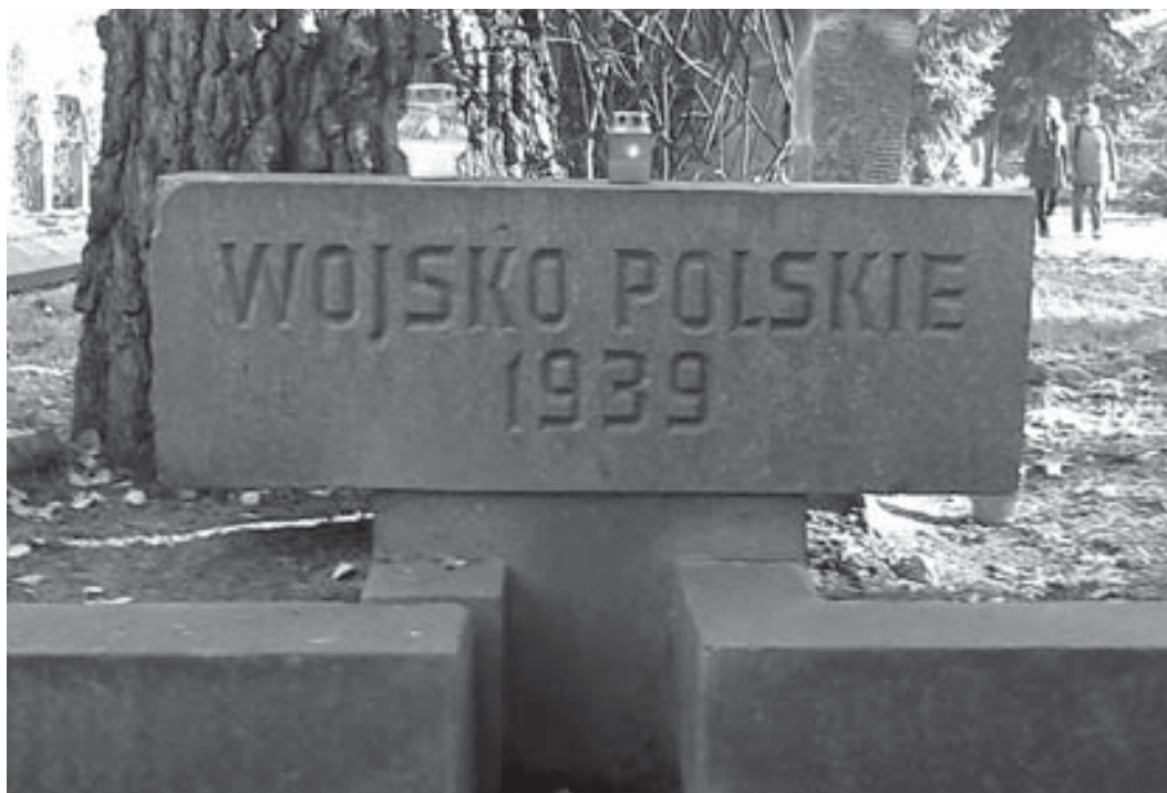
Oznaczenia kwater żołnierzy polskich poległych w 1939 r.