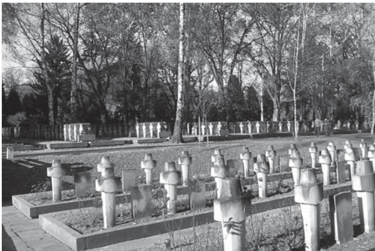
Nagrobki w formie „mieczokrzyży i tablic”