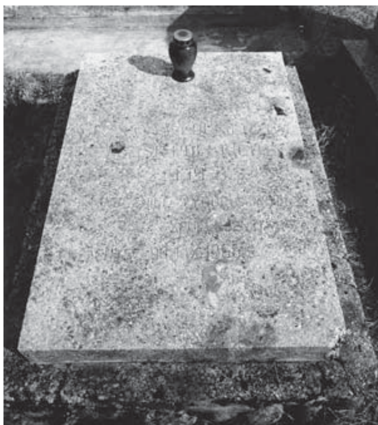
Skierkowizna. Grób nieznanego żołnierza.