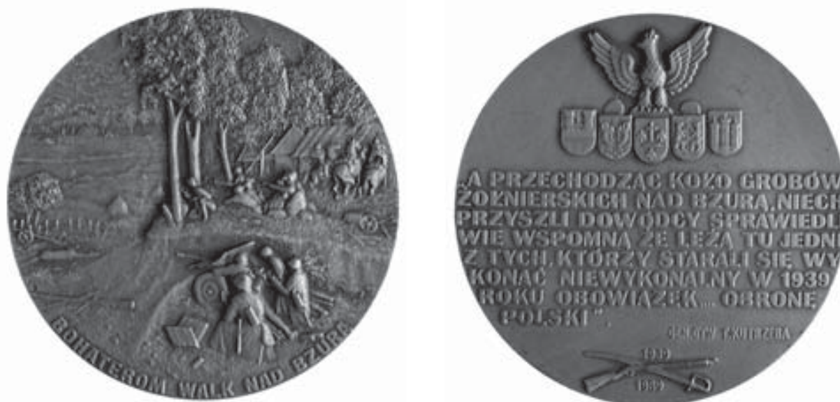
Medal pamiątkowy ku czci bohaterów walk nad Bzurą, wyemitowany przez Regionalny Komitet Obchodów 50. Rocznicy Bitwy nad Bzurą. Ze zbiorów Muzeum Niepodległości (nr inw. E 16394).