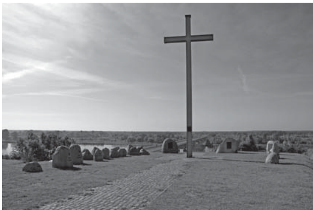
Wyszogród (przy zjeździe na przeprawę mostową). Kamienie upamiętniające żołnierzy Armii „Poznań” i „Pomorze” poległych w bitwie nad Bzurą.