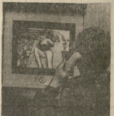
ne naciśnięcie kosztuje coraz drożej. („Der Spiegel”)

(a) Telefon z ekranem wykorzystano nie tylko do normalnego komunikowania się, lecz także dla rozrywki. W Hamburgu zainstalowano kabiny telefoniczne, które połączone są ze studium z modelkami. Po naciśnięciu tastera ukazuje się na ekranie zgrabna dziewczyna. Po naciśnięciu kolejnego tastera między dziewczyną a telefonującym nawiązana zostaje łączność słuchowa. Modelka spełnia życzenia telefonującego odnośnie poruszania się i pozy. Za naciśnięciem trzeciego tastera w ruch idzie osiem kamer ukazujące modelkę w różnym ułożeniu i w różnej perspektywie. Nie trzeba dodawać, że każde kolej-