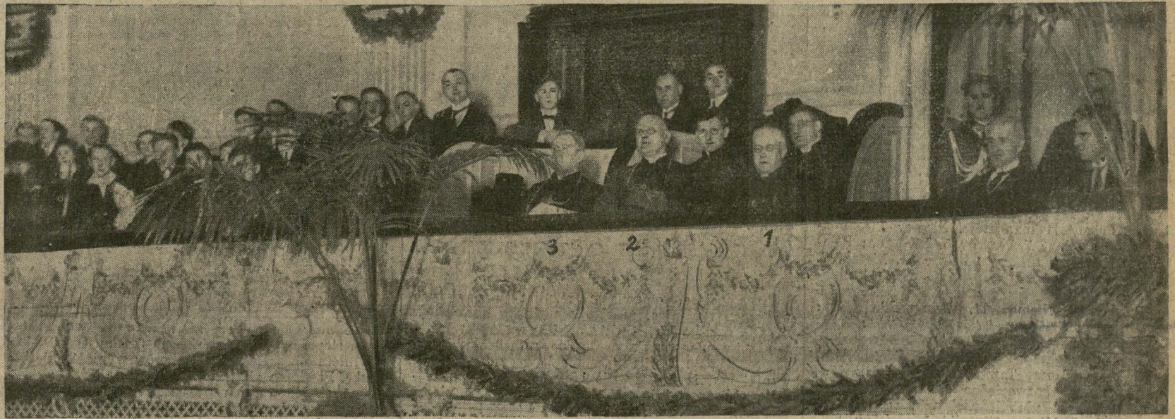
Zdjęcie na płycie kraj. „Alfa”.