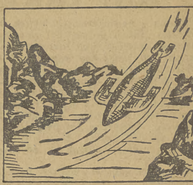
niby jastrzęb na swą zdobycz — Szybko w dół samolot spada, zła królowa plan swej zemsty już obmyśla i sposób.