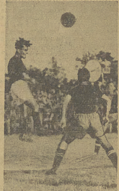
Ostatnio odbyły się w Krakowie zawody piłkarskie z cyklu rozgrywek o wejści... dzy miejscowa Wisła a RKS Szombierki. Drużyna gości zawiadła jednak i wywi... bramek w ilości 7-miu. A oto fragmenty z tych zawodów: na lewo Kohut... w środku Gracz zdobywający gólką 5-lą bramkę dla Wisły, po prawej