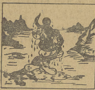
W rzeczy samej, był to Miki, mokry i na pół przy życiu — biedak, z trudem rozplątywał ściętą mackę ośmiornicy.