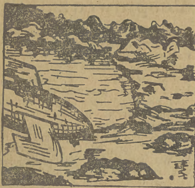
Nisko leci ten samolot, lecąc, krąży i kołuje. Wszystko dojrzy zła królowa, cały księżyc spenetruje!