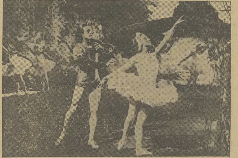
„Dziewczeta z baletu”. Bajeczny film radziecki o ludziach sceny i baletu. Reżyserii znakomitego Miedwiediewa. W rolach głównych: M. Redina, O. Zyzniewa, W. Kazanowicz. Produkcja: Lenfilm.