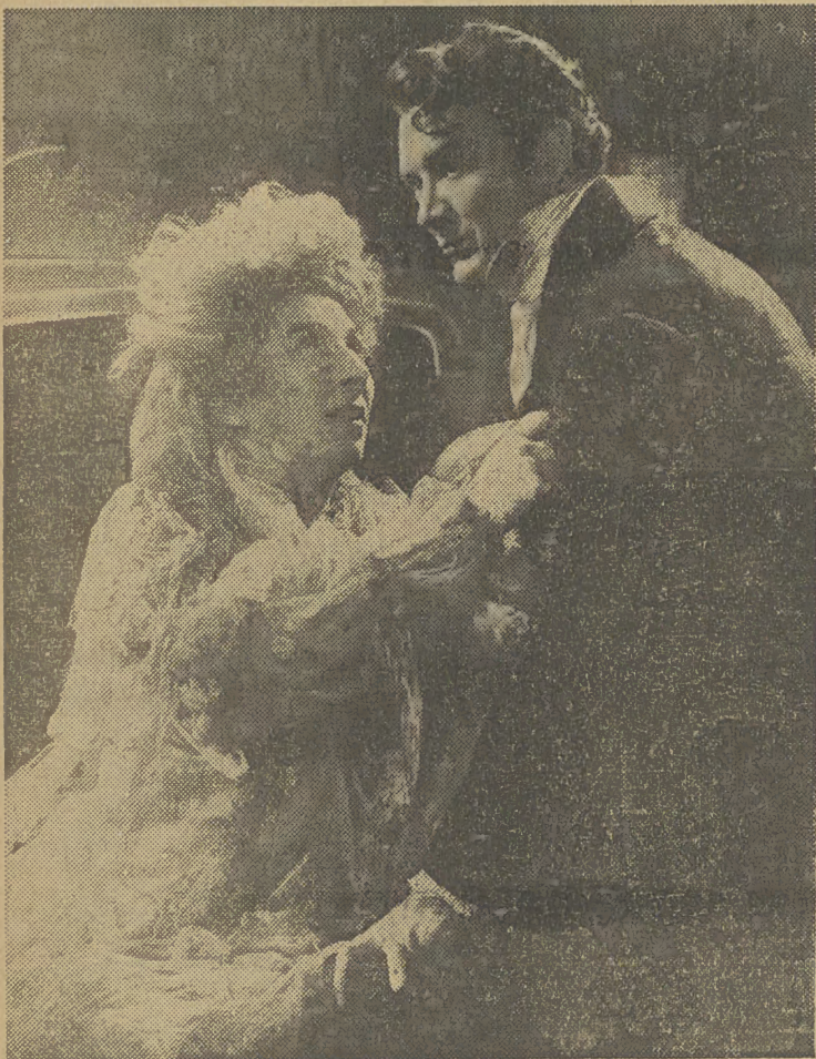
„Wielkie nadzieje”, ciekawy film produkcji angielskiej, według powieści nieśmiertelnego Karola Dickensa, reżyserji Davida Leana. W roli głównej: John Mills.