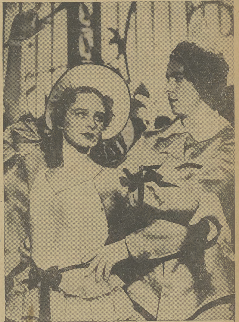
Zdjęcie z filmu produkcji radzieckiej p. t. „Dziewczyna z Baletu”