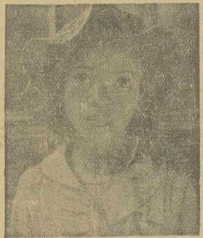
Z małego, nadzwyczaj zdolnego dziecka...

Wszystkie te fakty zilustrowała p. Fischer doskonale wykonanymi zdjęciami fotograficznymi, które można obecnie oglądać na wystawie w Foyles. Zamieszczamy parę reprodukcji tych zdjęć, za tygodnikiem angielskim „Illustrated”, który nie ośmielił się jednak reprodukować najbardziej charakterystycznych fotografii p. Fischer „ze względów rasowych...” (Kr.)