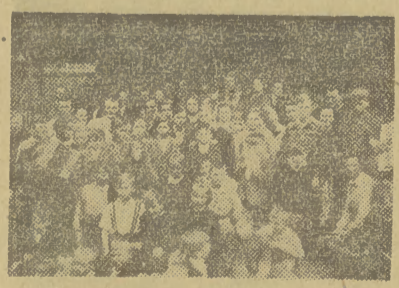
Mali „koloniści” i przybyli w odwiedziny rodzice pozują do wspólnej fotografii.

Mali „koloniści” znajdują pomieszczenie w specjalnych domach wypoczynkowych, pod opieką fachowych wychowawców, którzy dbają nie tylko o ich rozwój fizyczny, ale dokładają również wiele starań, by wyrobić w swych wychowankach