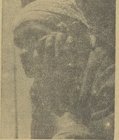
lub złamana życiem, stara kobieta

keia, położonej o 180 kilometrów na północny-wschód od Kapsztadu. — Wystawa p. Fischer obejmuje serie fotografii tubylców zamieszkujących te okolice. Prasa postępuje nazwała tę wystawę, wystawą zdjęć ludzi „najnędnniejszych z nędznych”. Nazwa ta jest w pełni uzasadniona. Nieubłagany obiektyw aparatu fotograficznego nie pominał żadnego, najmniejszego nawet, — szczególnie, świadczącego o niesłychanym upodleniu i nędzy, w jakiej