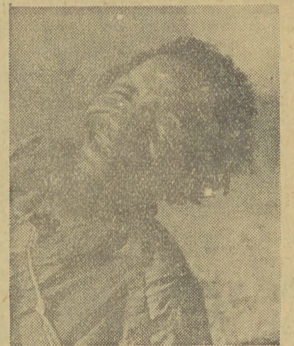
wyrasta na skutek bezłitosnej, zwierzęcej, pracy kopalnianej, w ciągu niewielu lat bezżebny starzec...