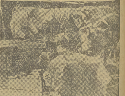
ciu widzimy go wraz ze swą żoną przy kroju tego rodzaju sukni. Policja Krasula patrzy z niepokojem czy suknia będzie elegancka i „do twarzy”.

By krowa dawała dużo mleka trzeba chronić ją przed chłodem i wilgocią. Do tego „odkrycia” doszedł pewien rolnik i... rozpoczął natychmiast produkować krowie suknie. Na zdję-