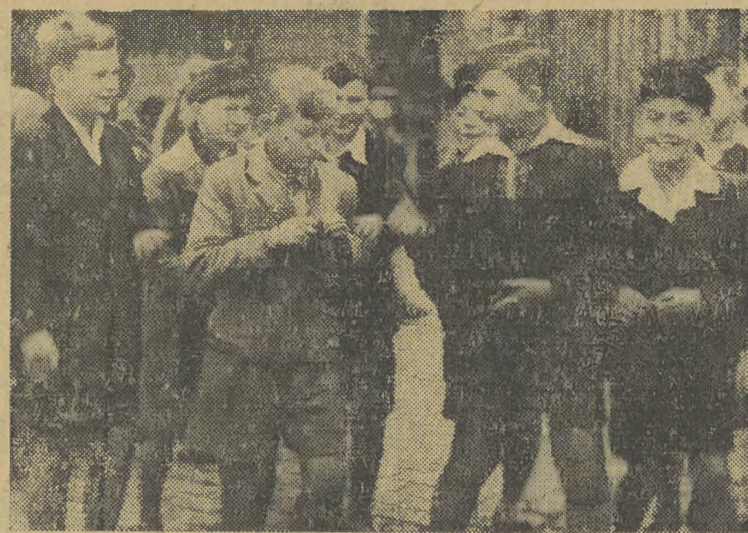
○ D wczesnego rana dziecińce szkolne rozbrzmiewają głosami młodzieży, która roz poczęła rok szkolny.