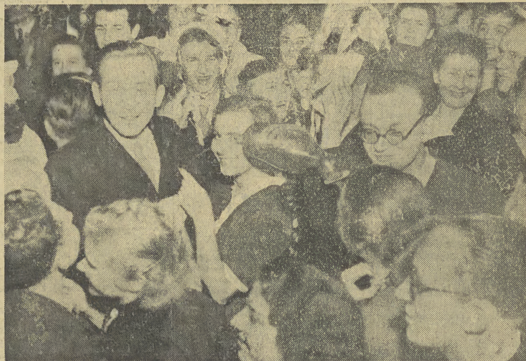
W ŚWIETLICACH i salach klubowych młodzież robotnicza wesoło spędza czas po pracy.