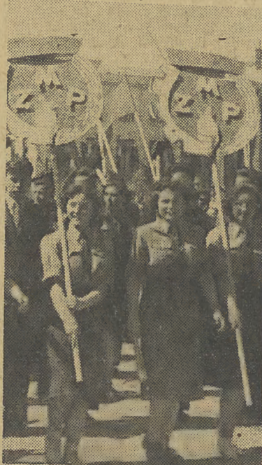
Przed trybuną honorową przechodzą długie szeregi uśmiechniętych ZMP-owców.