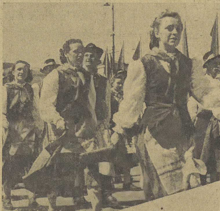
Defilada sportowców, żywo oklaskiwana przez mieszkańców Warszawy.