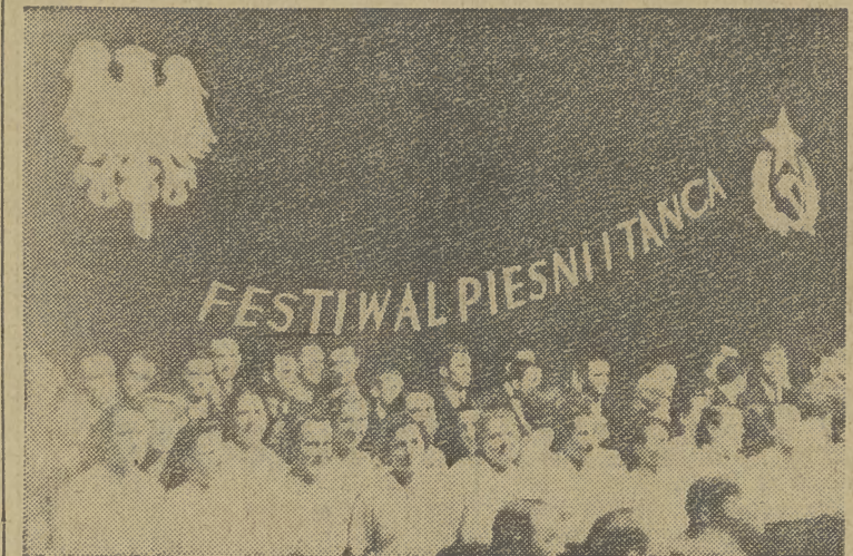
A oto inny zespół chórny — pracowników MRN w Krakowie, który zdobył pierwszą nagrodę w kategorii chorów mieszanych.