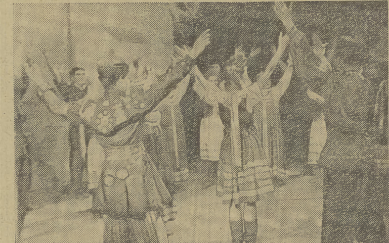
Kulminacyjny moment tańca tegoż zespołu pt. „Radość w pracy”, który symbolizuje udział robotników i chłopów oraz pomoc ludzi radzieckich przy budowie Nowej Huty.