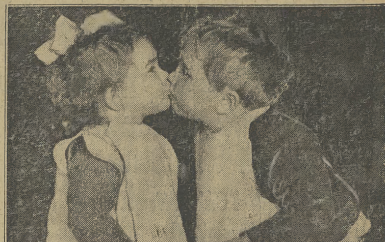
Dzieci z przedszkola składają sobie życzenia świąteczne i noworoczne przed feriami świątecznymi, które trwać będą do 8 stycznia.

● Zaprzestać „zimnej wojny” ● Porozumieć się ze Związkiem Radzieckim — takie są żądania demokratów amerykańskich