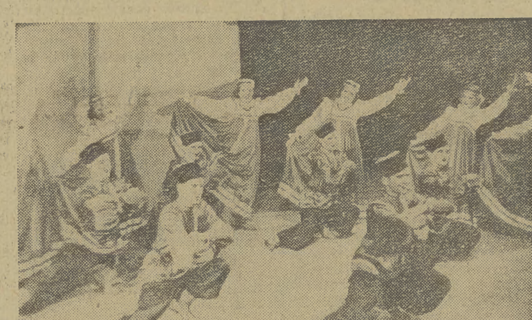
„Ognisty” kozak — w wykonaniu zespołu Zw. Zaw. Odzieżowców z Krakowa.

Wzorując się na zobowiązaniach drużyn manewrowych stacji Ilwo — pracownicy służby manewrowej na Dworcu Głównym i Towarowym w Krakowie podjęli tę formę współzawodnictwa. Każdy zespół zobowiązuje się przetoczyć bezawaryjnie po 30.000 wagonów. (St.)