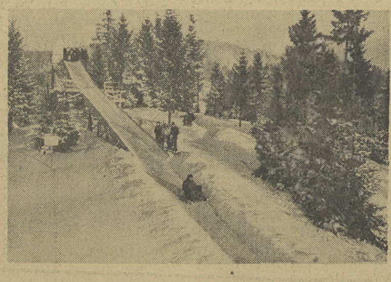
Tor saneczkowy z Góry Parkowej w Krymicy ożywił się...

W związku z szybkim wyczerpaniem się zapasu opału w najbliższym czasie sytuacja w Anglii stanie się na tyle krytyczna, że trzeba będzie zamknąć ważne przedsiębiorstwa przemysłowe.