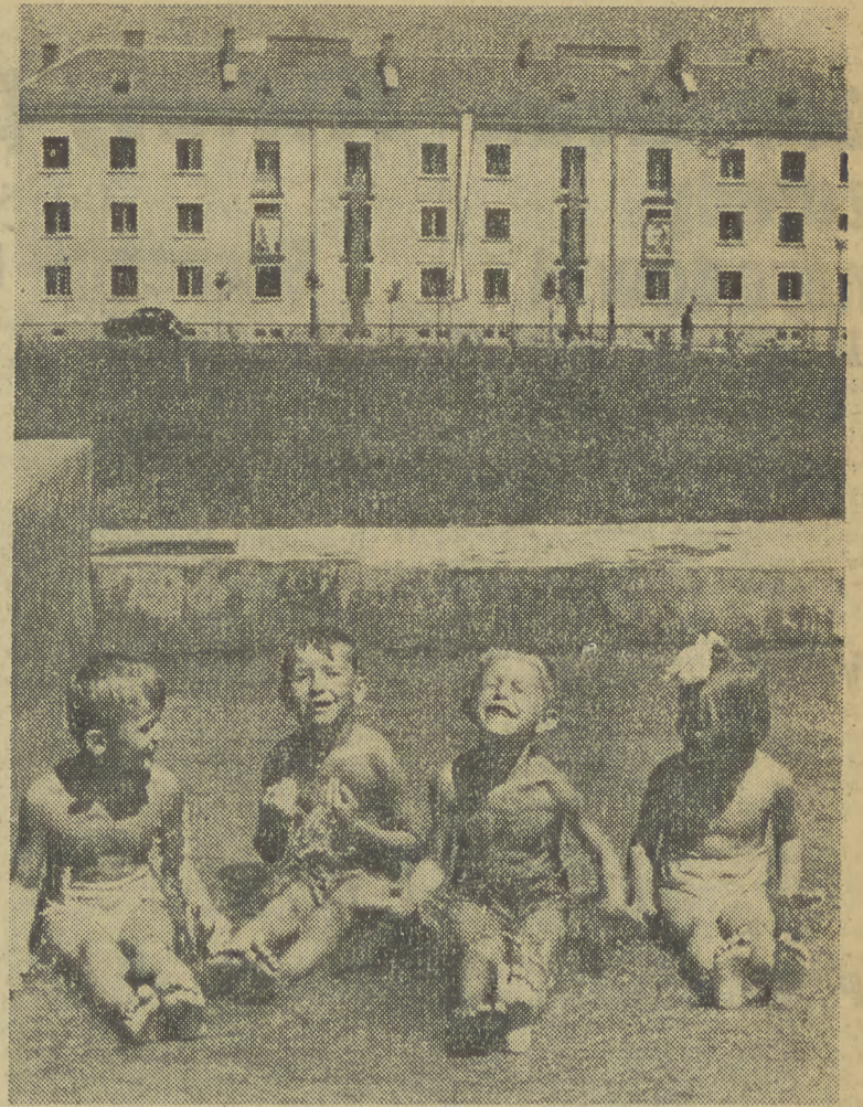
Zupełnie jak nad Wisłą — stwierdzają najmłodszy obywatele Nowej Huty, kąpiąc się z zapalem w nowoczesnie urządzonego brodziku na Osiedlu A-1. Dobry pomysł był jednak z tym brodzikiem! Bo i blisko i przyjemnie!

Z A KILKA dni zapłonie nowy wielki piec „B” w hucie „Kościusko”. Jest to największa inwestycja 1951 r. W godzinach rannych 29 bm. zakończono całkowicie montaż urządzeń automatycznych wielkiego pieca i rozpoczęto próby ich działania.