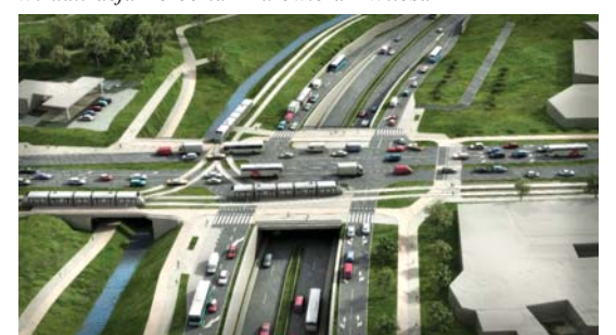
Wizualizacja Zakopiańska – Trasa Łagiewnicka