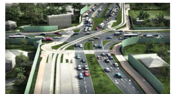
Wizualizacja Herberta – Turowicza – Witosa

wizualizacje: Trasa Łagiewnicka Spółka Akcyjna