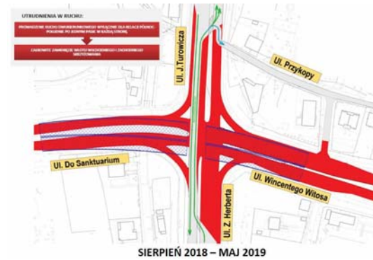
SIERPIEŃ 2018 – MAJ 2019