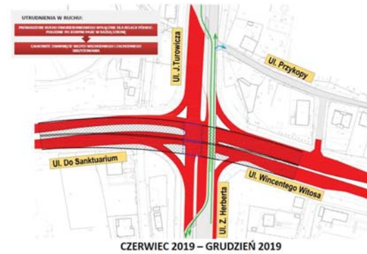
CZERWIEC 2019 – GRUDZIEŃ 2019