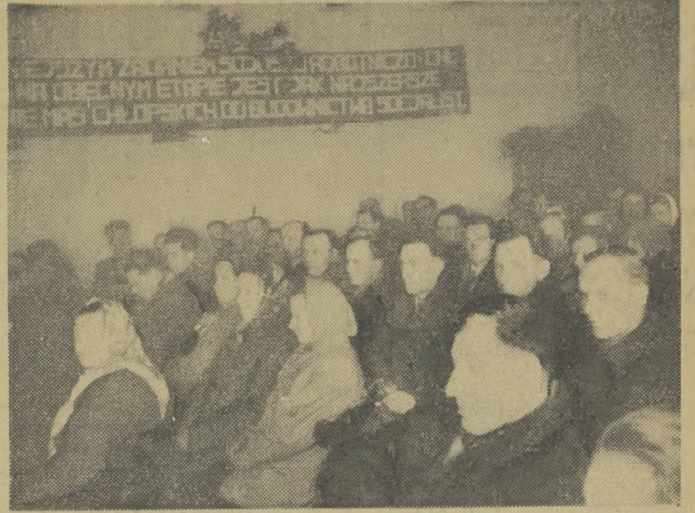
Spółdzielcy z Wysocia przystąpili w dniu 21 ub. m. do rocznego podziału wygosparowanego dochodu. Przybyli na walne zebranie członkowie innych spółdzielni produkcyjnych mieli możliwość zapoznać się z historią rozwoju i osiągnięć spółdzielni w Wysocicach, która w tym roku uzyskała dniówkę obrachunkową w wysokości 25 zł.