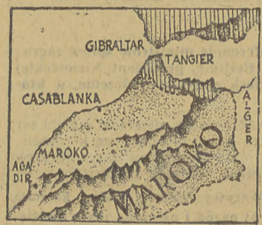
PARYŻ. (Obsl. własna)