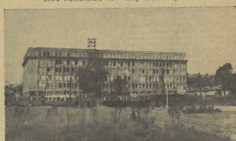
Biurowiec DOKP przy Rondzie