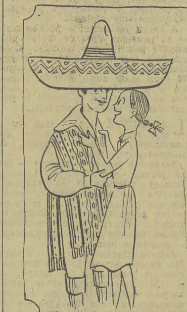
Alinka obdarowuje chustką.