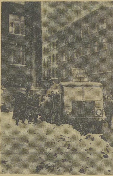
Przy wywożeniu śniegu pracują samochody nie tylko MPO, ale i innych przedsiębiorstw. Co prawda odwilż, zamieniając Kraków w jedną wielką kałużę, zaoszczędziła sporo roboty.

Inicjatywa pracowników Lasów Państwowych jest szczególnie cenna wobec szybko rosnącego zapotrzebowania różnych dziedzin naszej gospodarki na drzewo. (ja)