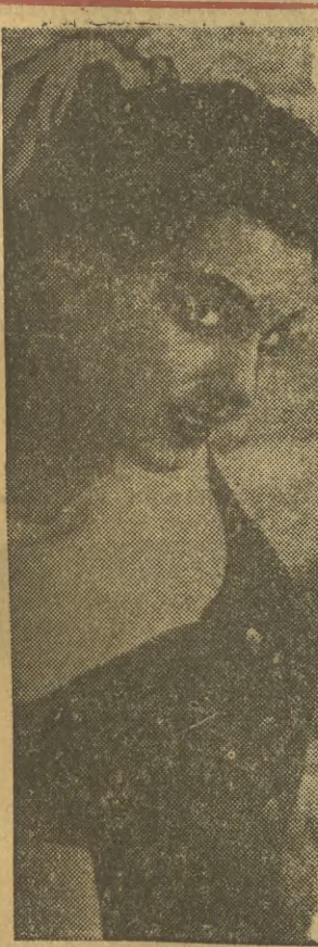
Nie, to jeszcze nie Miss Krakowa, ale już wkrótce będziemy ją mogli przedstawić naszym Czytelnikom. Szczegóły na str. 2.

Obok, na drugiej pochylni rośnie kadłub piątej jednostki tego typu.