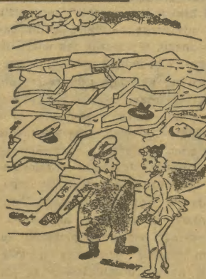
Wstęp na ślizgawkę uzbrojony. Komisja bada właśnie wytrzymałość lodu.