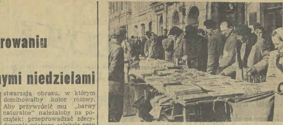
Stoisko obleżone. Słońce i wiosenne powietrze potęgują... apetyty bibliofilów.