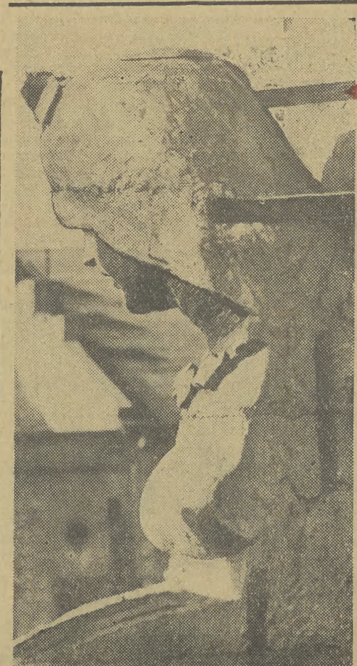
Głowa przywdziana w dwuróżny hełm słowiański. To popierście wspaniałej kobiety, która z wyżyn dachu Sukiennic obserwuje nieodmiennie dzień i noc „wielkomięjski ruch krakowski“ Rynku.

Macmillan powinien wykorzystać szansę, jaką daje ostatni list Bułganina i zasugerować rychłe spotkanie z przywódcami radzieckimi. Być może Eisenhower nie będzie chciał lub nie będzie w stanie przyłączyć się do rozmów. Nie ma jednak powodu, dla którego Macmillan nie miałby udać się do Moskwy i obszernie informować Eisenhowera o przebiegu rozmów.