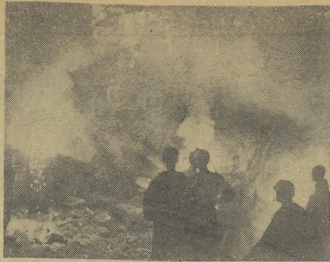
Krakowska Sekcja Tatarnicza Jaskiniowego Klubu Wysokogórskiego zorganizowała w Zakopanem międzynarodowy oboz grotolazów. Na oboz przybyli grotolazi z Austrii, Belgii, Bułgarii, Hiszpanii, Libanu i Węgier. Uczestnicy obozu w towarzystwie polskich speleologów zwiedzili najciekawsze jaskinie tatrzańskie. Na zdjęciu: W jaskini Raptawickiej.

Stan wody na Dunaju jest w dalszym ciągu bardzo wysoki. W wielu miejscowościach rzeka zalała nadbrzeżne tereny.