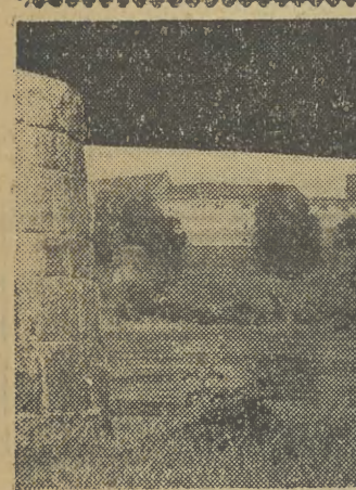
Wzgórze wawelskie wraz z całą zabudową architektoniczną jest — wieńczącym — tematem prac artystów malarzy i fotografików...