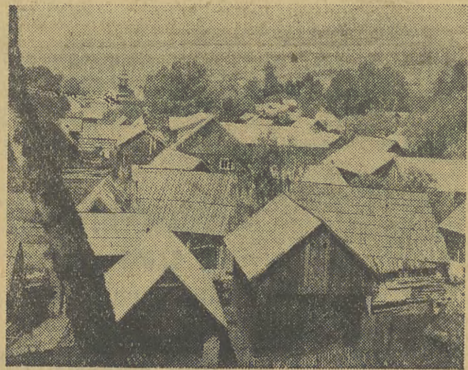
Wieś Maniowy. Jeżeli zostaną zrealizowane plany budowy zapory wodnej w Czorsztynie wieś ta będzie zalana wodą.

Powodem rozwodu był fakt, iż Barker „zmuszał Lanę przemocą do jedzenia, bijąc ją po twarzy, gdy nie miała ochoty jeść”.