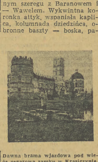
Dawna brama wjazdowa pod wieżą zegarową zamku w Krasiczynie.