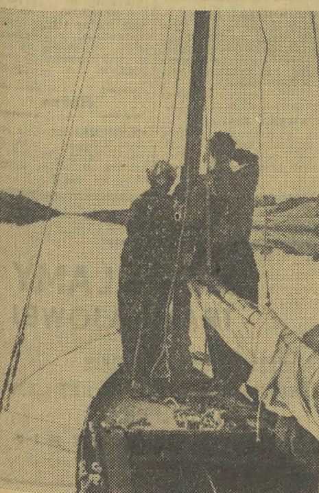
Kanal Im. Moskwy jest ulubioną trasą wycieczek mieszkańców stolicy ZSRR — miłośników sportów wodnych.

Od czasu do czasu opinią publiczną wstrząsają sensacyjne wiadomości o wielkich katastrofach kolejowych, a ostatnio — o katastrofach lotniczych. A jednak jak dowodzą tego statystyki i kolej, i samoloty są najbezpieczniejszymi środkami lokomocji. Najbardziej niebezpiecznym miejscem są... ulice wielkich miast. Na zorganizowanej w Nowym Jorku przez UNESCO wystawie poświęconej tym zagadnieniom odpowiednio wykresy stwierdzają, że niebezpieczeństwo utraty życia w ruchu ulicznym jest 10-krotnie większe niż w komunikacji powietrznej i kolejowej. Na ulicach miast zdarza się ponad 70 proc. wszystkich wypadków śmiertelnych, związanych z użyciem różnych środków komunikacji.