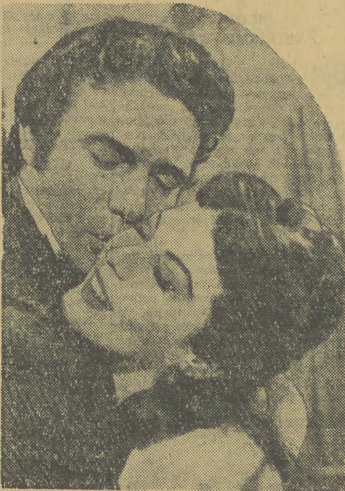
Scena z filmu o pięknej kobiecie i wielkim artyście.

W cieniu drzew niewielkiego lasu siedzi samotnie piękna kobieta. Świat wielki, hałaśliwy wraz z natrętnymi fotoreporterami pozostał daleko... Na małej polance, gdzie stoi prowizoryczne studio panuje spokój. Kobieta siedzi na wygodnym fotelu. Z magnetofonu dochodzą słowa piosenki: „Around the world I'll be searching for you”. To śpiewa Frank Sinatra. Niedługo przed 8 laty sławny dziś Frank mówił te słowa bezpośrednio. Potem pewnego dnia Ava powiedziała: „Gdybym była takim mężczyzną jak ty, nie kochałabym takiej kobiety jak ja”. Wkrótce potem nadszedł dzień, że sprawdziły się jej własne słowa... W garderobie zadzwonił dzwonek. Ava zamknęła elektrotrofon. Weszła garderobiana ze strojem, w jakim aktorka ma wystąpić w następnej scenie. Nagła metamorfoza to jednak trudna rzecz nawet dla artystki tej miary co Ava Gardner. Jeszcze parę minut, a na planie przed obiektywami zniknie całkowicie Ava a narodzi się słynna ze swej piękności i dość frywolnego życia księżna d'Alba.