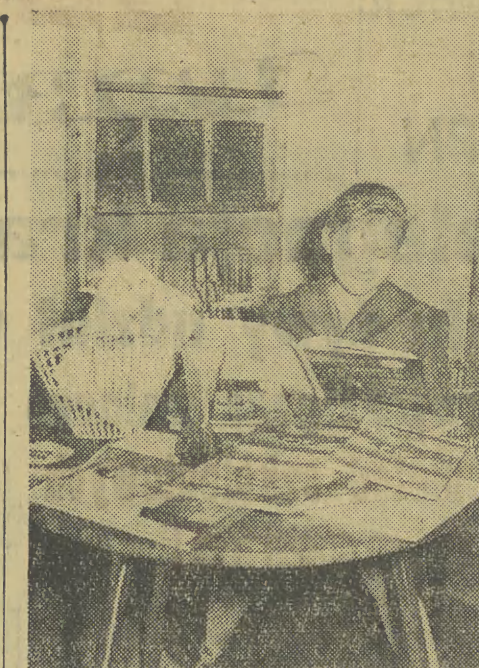
Gros klientel księgarni przy ul. 18 Stycznia w niedalekim sąsiedztwie bloków „Lajkonika” — to młodzież i dzieci. Zakupy przez nich dokonane to 60 proc. obrotu księgarni. A że dzieci w księgarni tej czują się znakomicie — najlepszym dowodem powyższe zdjęcie.

W wyższych uczelniach oficjalnie ferie rozpoczynają się 23 bm. i trwać będą do 2 stycznia. Tu jednak nie ma reguły bez wyjątków. Poszczególne uczelnie — zależnie komu podlegają — rozpoczynają ferie różnie, niektóre już od 20 bm. (dw)