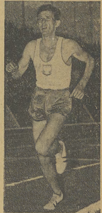
Podwójny mistrz Europy — Zdzisław Krzyszkowiak odniósł podczas meczu lekkoatletycznego Polski z Wielką Brytanią zwycięstwo w biegu na 3 tys. m z przeszkodami. Wydaje się, że nasz mistrz po przebytej chorobie wraca do formy.