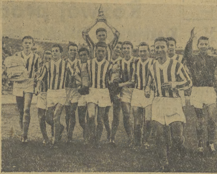
Prezentujemy 6-bok najmłodszych piłkarzy Cracovii, którzy zdobyli dla biało-czerwonych zaszczytny tytuł mistrza Polski juniorów — po zwycięstwie w finałowym meczu nad Arką Gdynia 3:0. Jeszcze raz gratulujemy i życzymy im aby byli godnymi kontynuatorami tradycji swych wielkich poprzedników i wydzignęli piłkarstwo swego klubu z obecnego impasu.