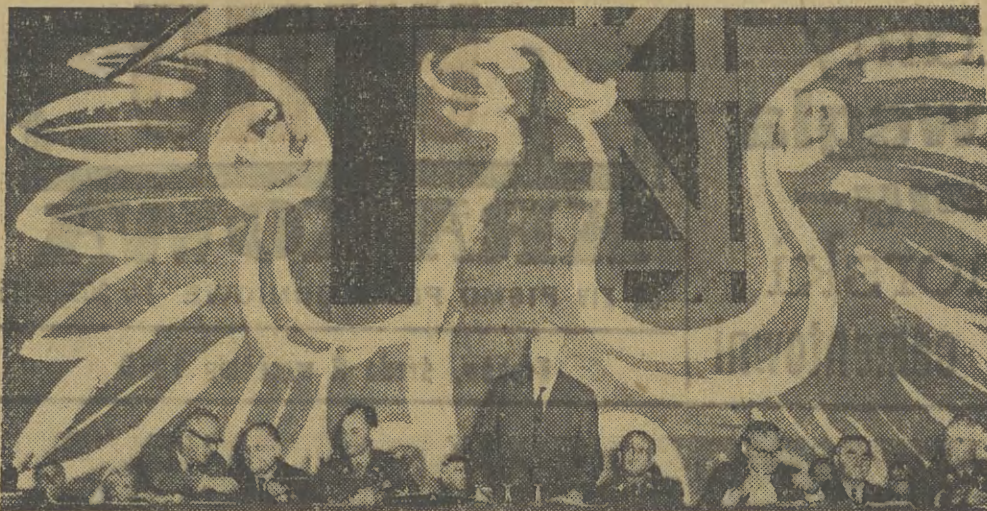
II Kongres Związku Bojowników o Wolność i Demokrację rozpoczął obrady. Na zdjęciu: Przemawia prezes Rady Ministrów J. Cyrankiewicz.

W 125-tej grze „LAJKONIKA” stwierdzono: Brak wygranych z 5-ma trafieniami, 8 wygranych z 4-ma trafieniami po zł. 3.069.—, 231 wygranych z 3-ma trafieniami po zł. 171.—, 4.174 wygrane z 2-ma trafieniami po zł. 9.—.