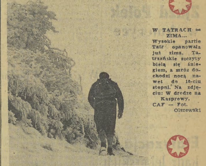
W TATRACH — ZIMA... Wysokie partie Tatr opanowała już zima. Tatzańskie szczyty białą się śniegiem, a mróz dochodzi nocą nawet do 10-ciu stopni. Na zdjęciu: w drodze na Kasprowy.

Zarządzenie swe dyrektor uzasadniał tym, że spodnie tego rodzaju „wprowadzają młodych ludzi w stan euforii”. Są one rodzajem mundurów, który sprawia, że ubrany w nich młodzieniec czuje się do przynależności do awanturniczego świata, z jakim spotyka się w książkach i w filmach.