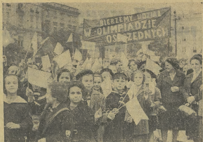
„Każdy uczeń uczestnikiem olimpiady oszczędnych”... „Oszczędzamy, by budować nowe szkoły”...