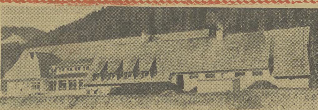
Widok stacji celnej od strony czesostowackiej.

bardziej narażony jest na wzmagającą się krytykę pewnych kół zarówno z wewnątrz, jak i z zewnątrz ONZ.