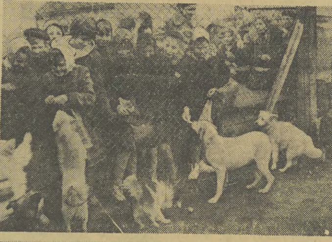
Dzieci ze Szkoły nr 1 przy ul. Marka 34 interesują się bardzo losem zwierząt. Zorganizowały one w poszczególnych klasach sześć kół przyjaciół zwierząt i utrzymują ścisły kontakt z Towarzystwem Opieki nad Zwierzętami.

W sklepie nie ma też wiśni i śliwek w czekoladzie, sezamek, chatwy, orzechów laskowych w czekoladzie, bloków czekoladowych z orzechami, a nawet cukierków miętowych. O takich wyrobach jak np. figurki czekoladowe nawet się nie mówi.