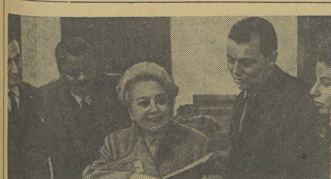
Tęci dal Monte to jedna z najbardziej oklaskiwanych Ilrycznych śpiewaczek naszych czasów. Ale lata płyną i wspaniała śpiewaczka zdaje sobie sprawę, że bezpieczniej już dla niej uczyć młodzież niż samej występować. W jej mediolańskim mieszkaniu zawsze jest pełno młodych śpiewaków, którzy być może w przyszłości dorównają stawą swej mistrzyni. (bk)

klamowany szumnie, frekwencja była wielka, a więc wpływy kasowe też niemałe. Jednym słowem zanosiło się na to, że godny poparcia fundusz zostanie poważnie zasilony. Wielkie było więc zdziwienie, gdy po zamknięciu rachunków balu okazało się, że czysty dochód wyniósł zaledwie 169 marek. Po przeliczeniu rozliczeń okazało się, że winę za to ponoszą zaproszone na bal gwiazdy i gwiazdki filmowe, które miały być magnesem, przyciągającym balowych gości. Oczywiście gwiazdy „występowały” na balu bezinteresownie, ze swej strony traktując to jako wkład w powodzenie dobroczynnej akcji. Bezinteresowność okazała się jednak podejrzana, skoro gwiazdki policyzowały sobie diety, dochodzące w poszczególnych wypadkach do kwoty 200 dolarów. Obecnie władze Duisburga zastanawiają się, czy całej imprezy nie obłożyć podatkiem, od którego pod płaszczykiem dobroczynności organizatorzy balu zostali zwolnieni. (i)