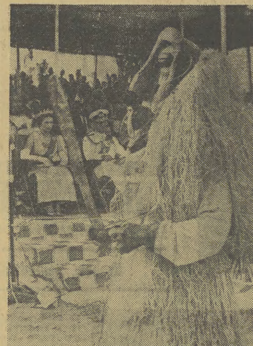
Królowa angielska Elżbieta odbyła podróż po Afryce odwiedzając kolejno wszystkie białe kolonie angielskie, które obecnie uzyskały niepodległość. Po wizycie w Ghanie królowa Elżbieta udała się do najmłodszej republiki afrykańskiej Sierra Leone. W związku z wizytą królowej odbyły się w Sierra Leone uroczystości w których brał udział przedstawicielstwo polskie zamieszkujących ten kraj. Na zdjęciu: Czarownik jednego z plemion, żyjących w dżungli, w rytualnej masce defiluje przed królową Elżbietą w stolicy Sierra Leone.