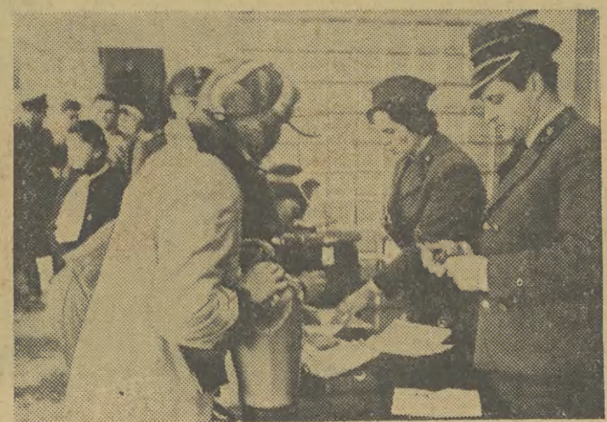
Pierwsi turyści na oświadczenie celnej w nowym budynku. (Na zdjęciu obok)

Jutro Kraków będzie pod wpływem niżu. Zachmurzenie duże z przejaśnieniami, możliwe drobne opady deszczu, występujące od zachodu kraju. Wiatr południowo-zachodni i zachodni 3-6 m/sek. Temperatura plus 10 do plus 12 st. C.